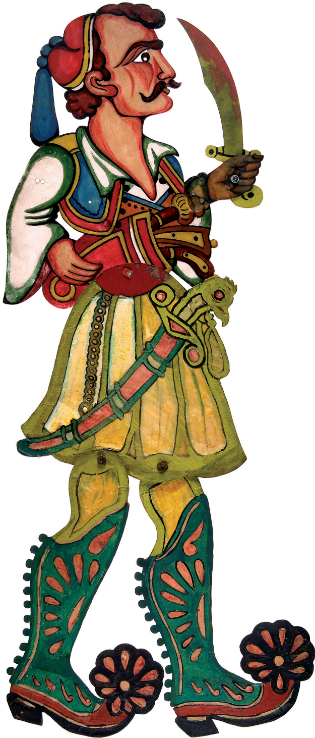
Εικ. 11. Καπετάνιος(ς), φιγούρα του ελληνικού θεάτρου σκιών, χαρτόνι, χαρτί, πολυεστέρας. Αθήνα, Μουσείο Μπενάκη, αρ. ευρ. 40036. Δωρεά Ευγένιου Σπαθάρη.

ορθόδοξο Αλβανό. Οι Έλληνες 21 εμφανίζονται πιο συχνά σε σχέση με τον καθολικό ή τον διαμαρτυρούμενο.