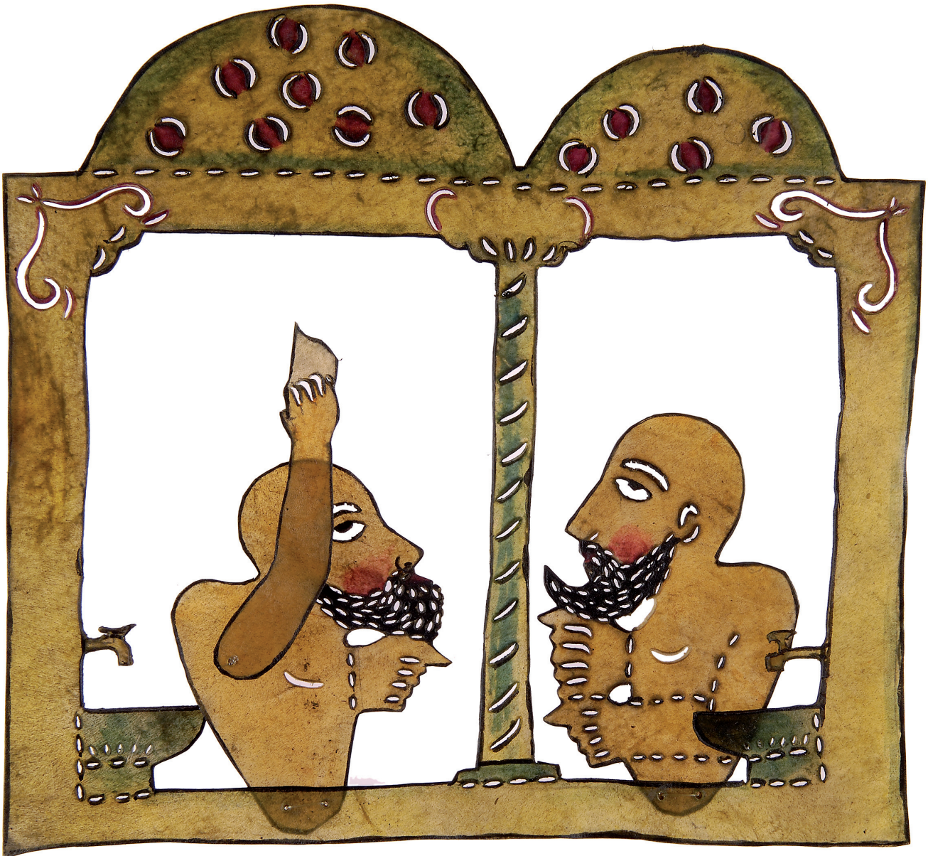
Εικ. 6. Από αριστερά προς τα δεξιά: ο Καραγκιόζ και ο Χατζιβάτ στο χαμάμ, φιγούρες του τουρκικού θεάτρου σκιών, περγαμηνή. Αθήνα, ιδιωτική συλλογή.

ήταν το σαράι ανεξάρτητα από το αν ήταν στην ανατολική ή τη δυτική όχθη του Βοσπόρου, σε κάθε περίπτωση όμως στην Κωνσταντινούπολη. Το θέατρο σκιών βάζει το σαράι απέναντι από την καλύβα.