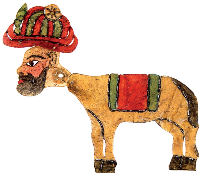
Εικ. 7. Ο Καραγκιόζ γάιδαρος από το έργο Cazutâr [Τζατζόγριες ή Μάγισσες], φιγούρα του τουρκικού θεάτρου σκιών, περγαμνή. Αθήνα, ιδιωτική συλλογή.

πους της διανόησης, αλλά και τους ιστορικούς και τους πολιτικούς, οι οποίοι έπρεπε να βρουν απαντήσεις και να κατευθύνουν το επαναστατικό κίνημα. Ενδιαφέρον είναι ότι το θέατρο σκιών έκανε μια σύμπτυξη αυτών των θέσεων παρόμοια με αυτή του μέσου Ελλαδίτη. Άλλωστε, αυτό συνέβαινε και στην πραγματικότητα. Τον 19ο αιώνα δεν υπήρχε για τον καραγκιοζοπαίκτη, όπως και για τον λαό, καμία σύγχυση των εννοιών και των όρων μιλέτ και γένος. Το έθνος είναι μια πιο σύγχρονη έννοια. Στον βαλκανικό χώρο, αυτή την περίοδο, εμφανίστηκαν και διαμορφώθηκαν όλα τα νέα έθνη μέσα από το ελληνορθόδοξο μιλέτ. 10 Κοινός στόχος όλων των ορθοδόξων ήταν οι Οθωμανοί.