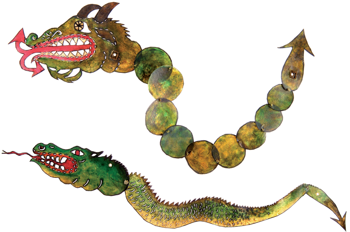
Εικ. 9. Το μεγάλο και το μικρό φίδι από τα έργα του Μεγαλέξανδρου, φιγούρες του ελληνικού θεάτρου σκιών, περγαμηνή. Αθήνα, ιδιωτική συλλογή.

νοντας στη θρησκεία τον πρωταρχικό ρόλο, ξεχωρίζοντάς την ταυτόχρονα από την εκκλησιαστική εξουσία.