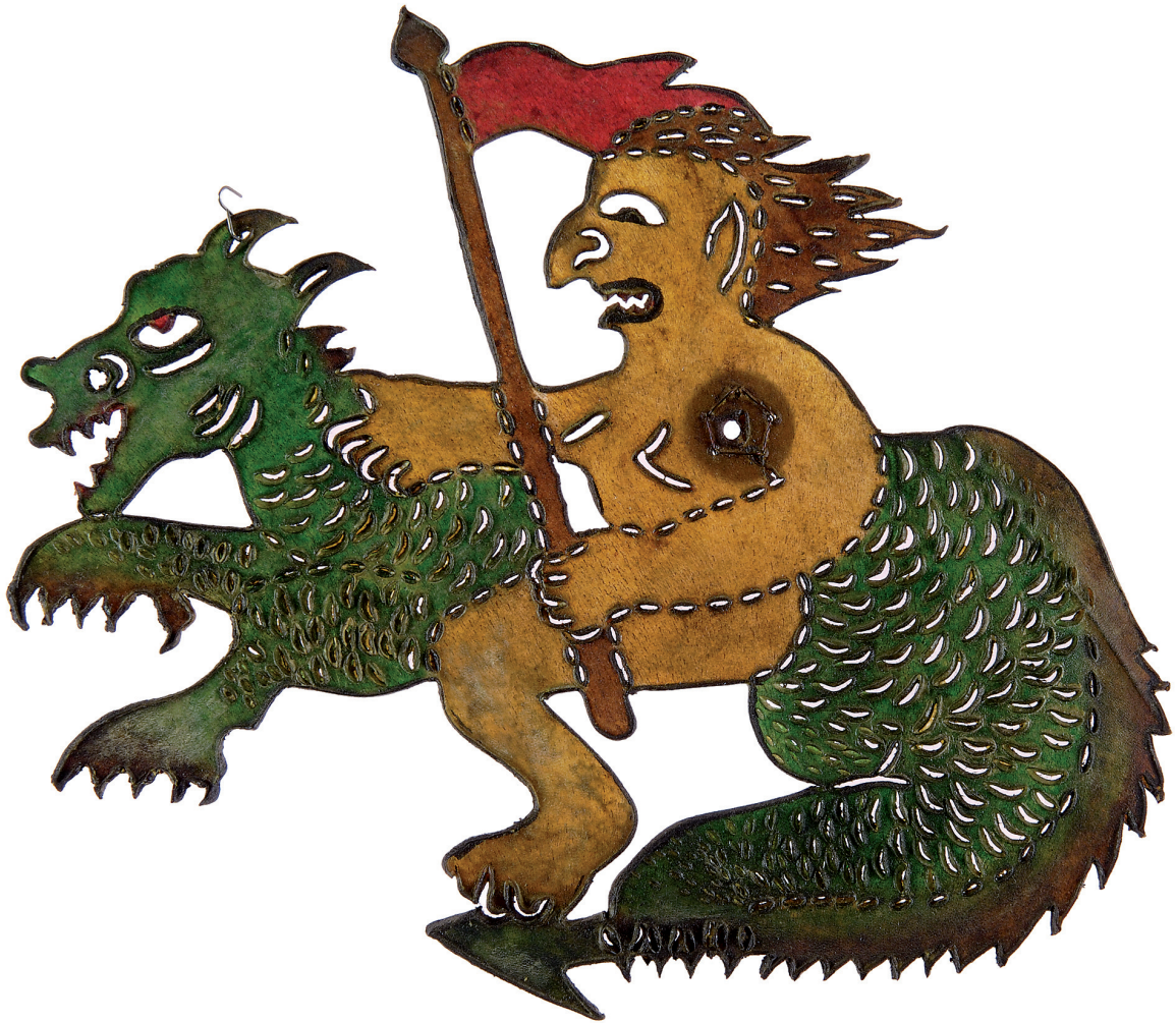
Εικ. 2. Το Τζίνι από το έργο Cazutâr [Τζατζόγριες ή Μάγισσες], φιγούρα του τουρκικού θεάτρου σκιών, περγαμηνή. Αθήνα, ιδιωτική συλλογή.

Το πρώτο σύνταγμα της Ελλάδας στην απόσχισή της από την αυτοκρατορία έκανε την επίσημη διάκριση, αποκαλώντας τους κατακτητές Οθωμανούς και όχι Τούρκους. Με το Σύνταγμα του 1844 είχε επέλθει μια ωρίμανση των εθνικών επιδιώξεων και επανακαθορίστηκε για άλλη μια φορά ο στόχος: « Ο πόλεμος ήταν γενικώς όλης της ελληνικής φυλής κατά των Μωαμεθανών, και τούτο ουδείς αρνείται. Ούτω τον εξέλαβεν η Ευρώπη, ο Σουλτάνος και αι Εθνικάί μας Συνελεύσεις ». Οι Εθνικές Συνελεύσεις έθεσαν τις βάσεις του νέου κράτους και οι ευρωπαϊκές δυνάμεις στήριξαν τον αγώνα κατά του σουλτάνου. Στην περίπτωση αυτή ο σουλτάνος ήταν ολόκληρη η Ανατολή, η αντίπερα όχθη. Αυτή την επίσημη θέση την αποδέχθηκε και την αναπαρέστησε στο σκηνικό του το λαϊκό θέατρο·