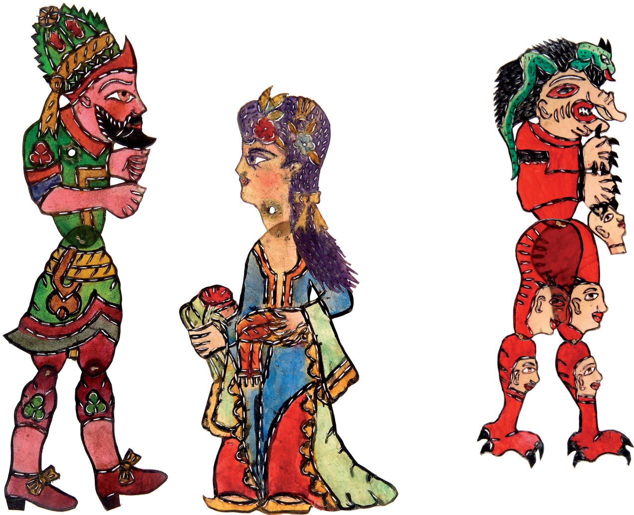
Εικ. 3. Από αριστερά προς τα δεξιά: ο Χατζιβάρ, η Ζεννέ και το Τζίνι, φιγούρες του τουρκικού θεάτρου σκιών, περγαμινή. Αθήνα, ιδιωτική συλλογή.

Ακριβώς επειδή μορφοποιήθηκε στη διάρκεια της διαδικασίας για τη δημιουργία του εθνικού κράτους, ο Καραγκιόζης δίνει την εικόνα ενός κόσμου ρευστού, όσον αφορά τις ταυτότητες των ηρώων του και τις αξίες τους. Είναι η ακριβής προσέγγιση των δυσκολιών που αντιμετώπισαν οι Ελλαδίτες στην αποδοχή της νέας τους εθνικής ταυτότητας και στην απόρριψη της οθωμανικής σκοπιάς. Αυτό αντανακλάται στην επιλογή των ηρώων και ακόμα πιο άμεσα μεταφέρεται από την αντίληψή τους για τον κόσμο.