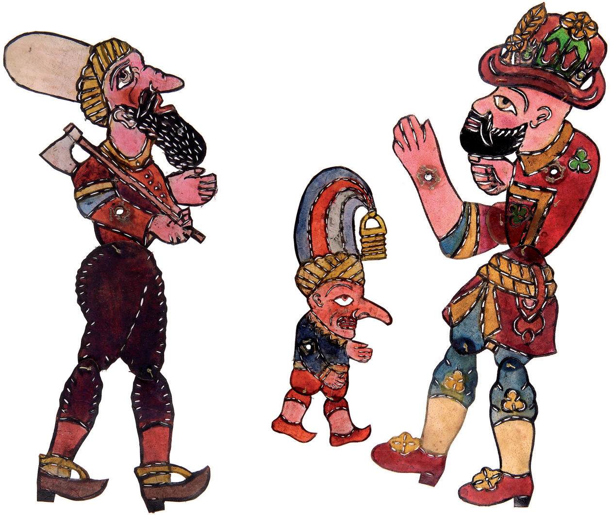
Εικ. 4. Από αριστερά προς τα δεξιά: ο Μπαμπά Χιμέτ (Τούρκος αντίστοιχος του Μπαρμπαγιώργου), ο Μπεπερούι (αντίστοιχος του Μορφονιού) και ο Καραγκιόζ, φιγούρες του τουρκικού θεάτρου σκιών, περγαμινή. Αθήνα, ιδιωτική συλλογή.

με την αναπαραγωγή και τη ρεαλιστική αντιμετώπιση της καθημερινότητας ήταν ζήτημα επιβίωσης για τον Καραγκιόζη. Ως αποτέλεσμα, τα έργα μας παρέχουν θέσεις λιγότερο επεξεργασμένες από τις επίσημες θέσεις της εθνικής μας ιστορίας.