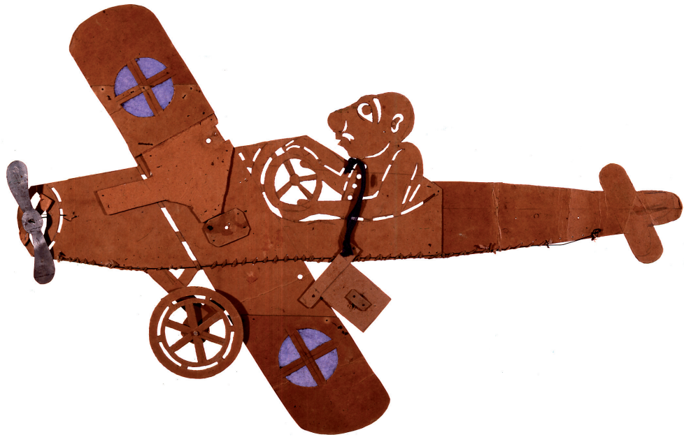
Εικ. 13. Ο Καραγκιόζης αεροπόρος από το έργο Ο Γάμος του Καραγκιόζη , φιγούρα του καραγκιοζοπαίχτη Σωτήρη Σπαθάρη, χαρτόνι. Αθήνα, Μουσείο Μπενάκη, αρ. ευρ. 40035. Δωρεά Ευγένιου Σπαθάρη.

οθωμανικό ρεπερτόριο ασχολούνται με καθημερινά θέματα, όπως λόγου χάρι Ο Γάμος του Μπαρμπαγιώργη από το αντίστοιχο Sabte Gelin [Ψεύτικη Νύφη], ή με την ανεύρεση εργασίας, όπως Ο Καραγκιόζης Φαρμακοποιός από το Ezhane [Φαρμακείο], Γιατρός με το Στανιό από το Hekimlik κ.ά.