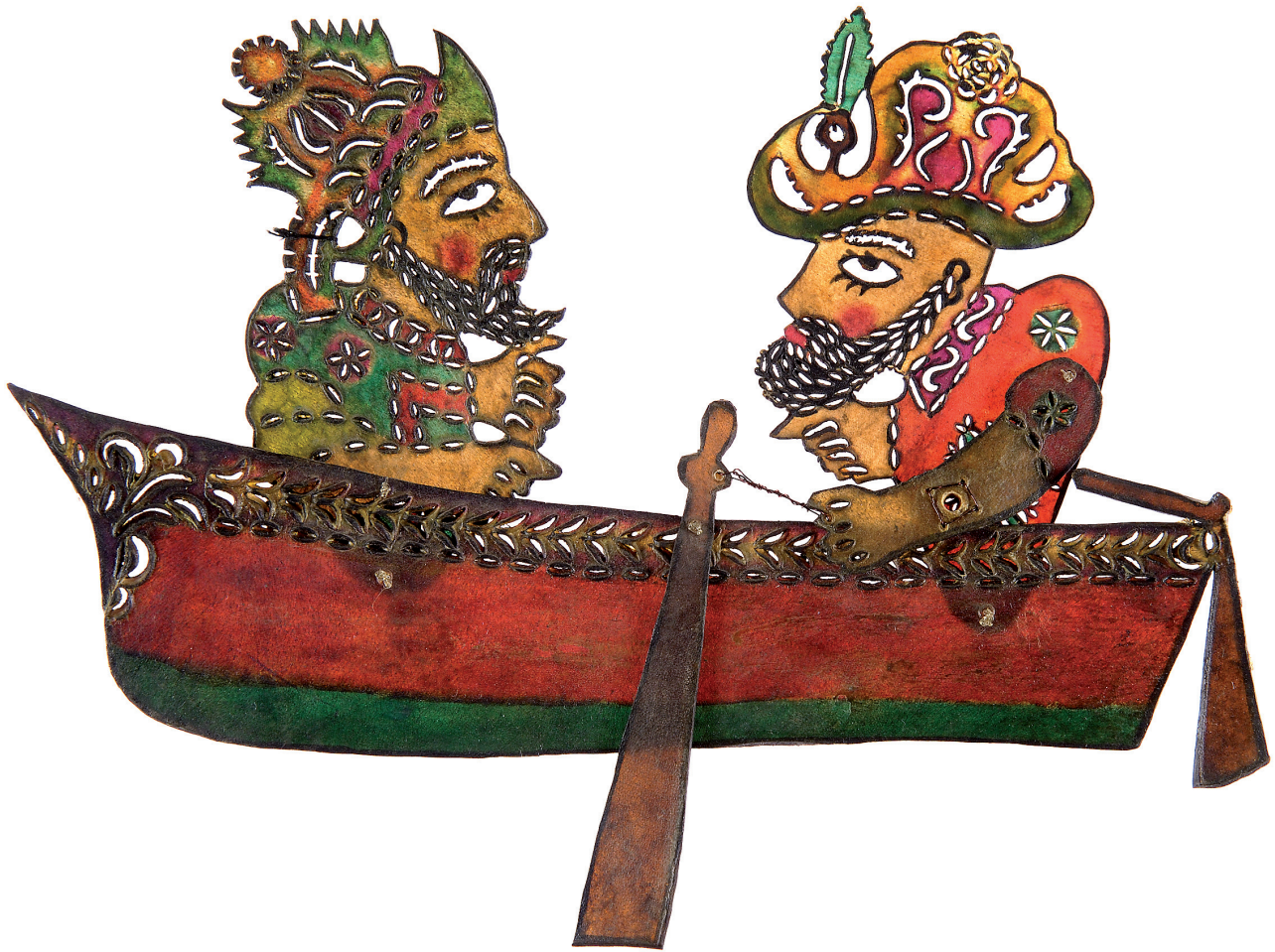
Εικ. 8. Από αριστερά προς τα δεξιά: ο Χατζιβάτ και ο Καραγκιόζ βαρκάρηδες από το έργο Kayik [Καϊκι], φιγούρες του τουρκικού θεάτρου σκιών, περγαμηνή. Αθήνα, ιδιωτική συλλογή.

οποιαδήποτε εκκλησιαστική ηγεσία. Εκ των πραγμάτων, το εθνικό κράτος ήρθε σε μια διπολική αντιπαράθεση με τους Οθωμανούς και με την άρχουσα τάξη των Ελλήνων της Πόλης. Όμως ο Καραγκιόζης δεν έβαλε το Πατριαρχείο και τους Φαναριώτες μαζί με τους Οθωμανούς. Αυτή η ομαδοποίηση δεν έγινε ορατή στο λαϊκό θέατρο. Το πιο πιθανό είναι ότι οι καραγκιοζοπαίχτες απλά άφησαν στην άκρη ένα ζήτημα τόσο λεπτό και δύσκολο σε οποιονδήποτε συναισθηματικό και πολιτικό χειρισμό. Απλά ο Καραγκιόζης ενστερνίστηκε και διατήρησε τη θέση της επίσημης εθνικής ιστορίας και επέτρεψε στους δημιουργούς του, τους ανώνυμους καλλιτέχνες, να εκφράζονται ανενόχλητοι.