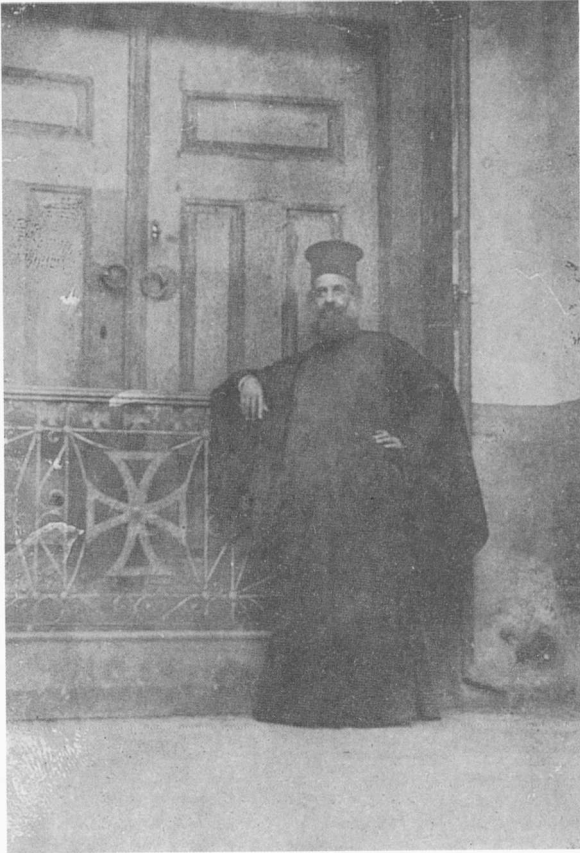
Ὁ Γερμανὸς Καραβαγγέλης μπροστὰ στὴν κλειστὴ πύλη τοῦ Οἰκουμενικοῦ Πατριαρχείου