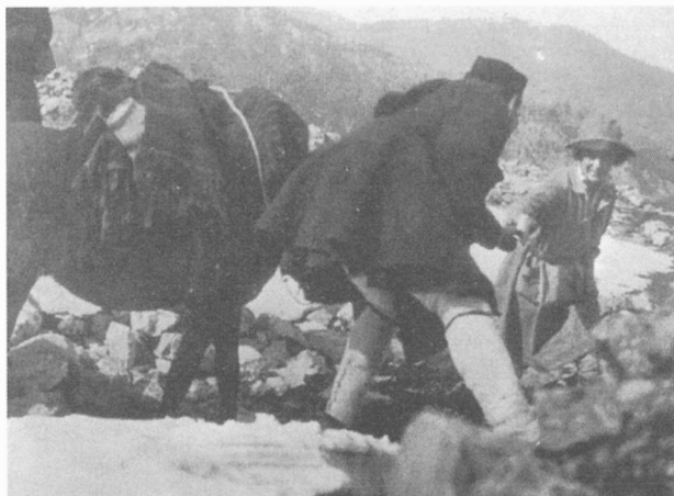
3. Μέσα δεκαετίας τοῦ 1920, Ἐπιτροπή Ἀποκαταστάσεως Προσφύγων: Δεξιιά, ἡ "Ελλη στήν ὄρεινή ἑλληνική ὑπαιθρο