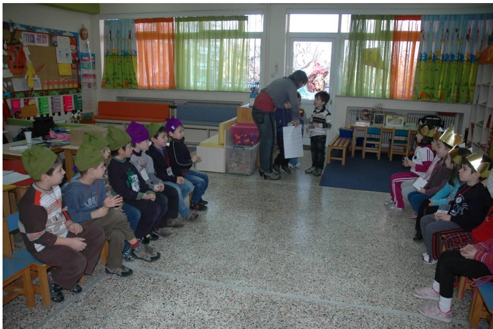
Φωτογραφία 4. Το παιχνίδι ξεκινά (Φάση 4)