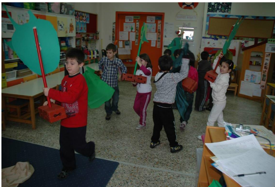
Φωτογραφία 8. Επαναφορά του χώρου στην αρχική του μορφή (Φάση 4)