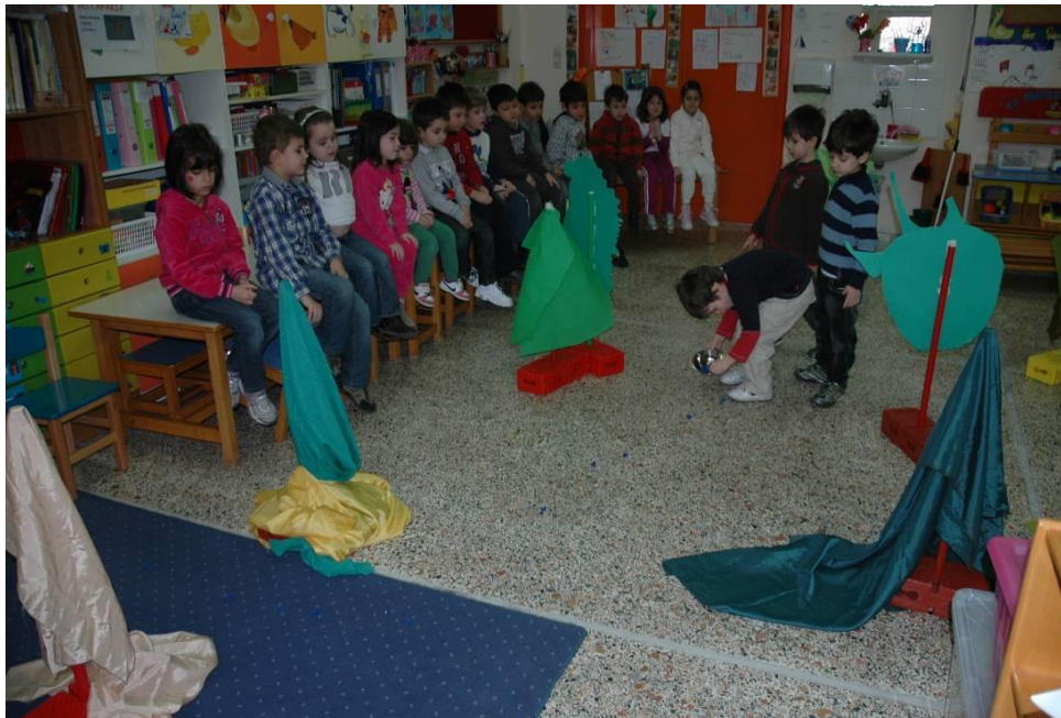
Φωτογραφία 7. Παίζουν το παιχνίδι (Φάση 3)