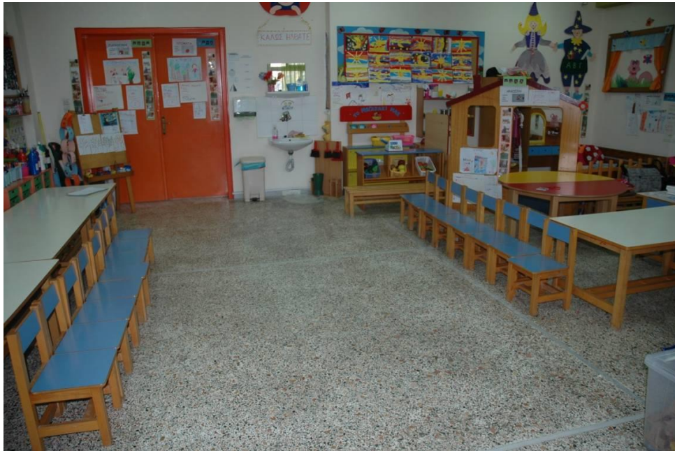
Φωτογραφία 3. Ο χώρος είναι έτοιμος! (Φάση 3)