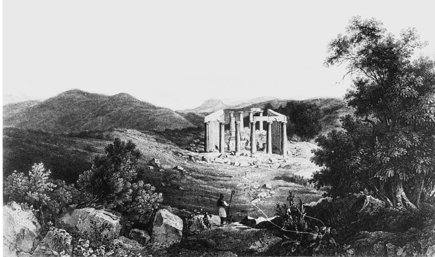
Temple d'Apollon Épicurien à Bassae. Abel Blouet, Expédition , Vol. II, p. 30.

le bruit des vents, des flots et de la création entière, son harmonie, et l'ensemble de tout cela, sa poésie. En ce qui concerne plus particulièrement les Grecs, l'art a été pour eux une apothéose de l'humanité.