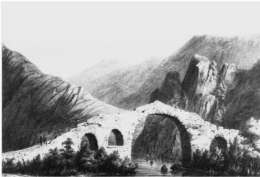
Pont de l'Eurotas.

les contemple; peut-être font-elles crouler en nous subitement tout ce qui n'y est pas immortel; car ce qui me manquait, c'était bien moins Sparte que les choses que je ne trouvais plus en moi. Je ne sais quoi me disait que j'avais laissé les plus beaux et les derniers fantômes de ma jeunesse dans les décombres de Palæochorio, et que pour longtemps je retrouverais au milieu de tous les spectacles l'odeur des grèves plombées de l'Eurotas et les tombeaux remplis du sable de la Magoulitza. 45