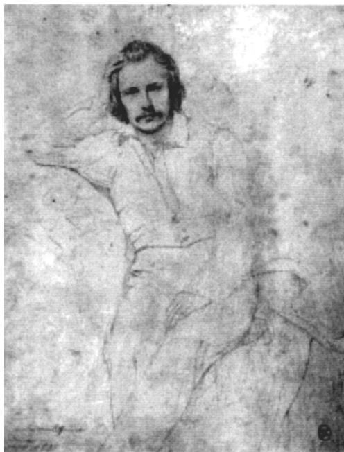
Edgar Quinet en 1833. Dessin de Sébastien Melchior Cornu, Musée Carnavalet, Paris.