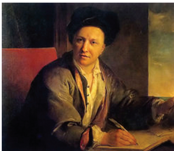
Portrait de Fontenelle par Louis Galloche, 1723