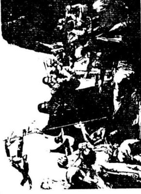
Εικόνα 1. Μια σελίδα από το βιβλίο «Η Φωνή των Καλαβρυτών» που δημοσιεύθηκε στην Αθήνα το 1821.

Εικόνα 2. Το φύλλο της εφ. Η Φωνή των Καλαβρυτών, όπου αναδημοσιεύτηκε το κείμενο από την εφ. Le Constitutionnel.