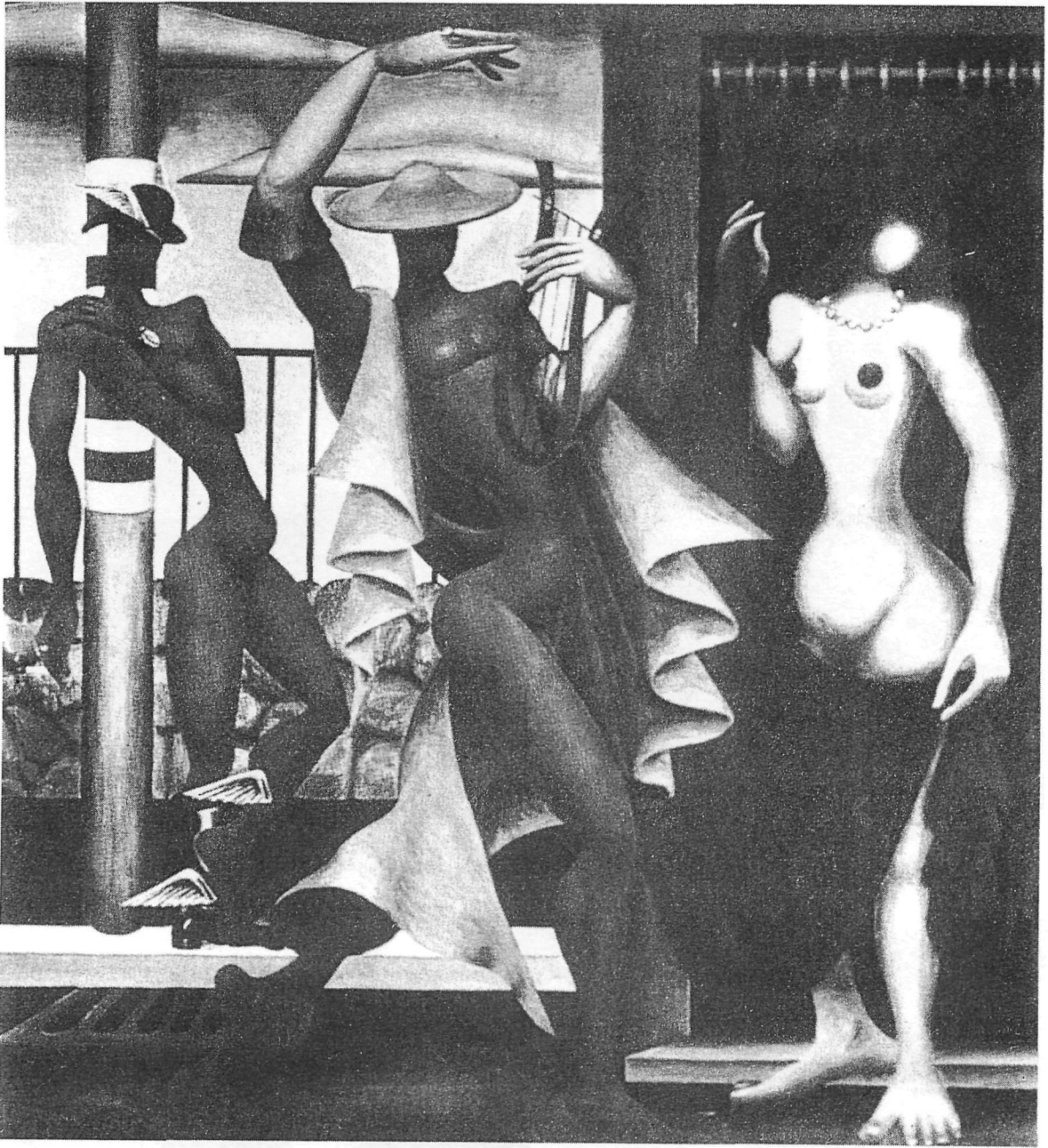
Νίκος Εγγονόπουλος, Ορφεύς και Ευρυδίκη