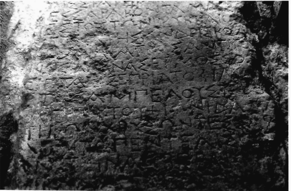
Π. Χρυσσοτόμου Ειχ. 3