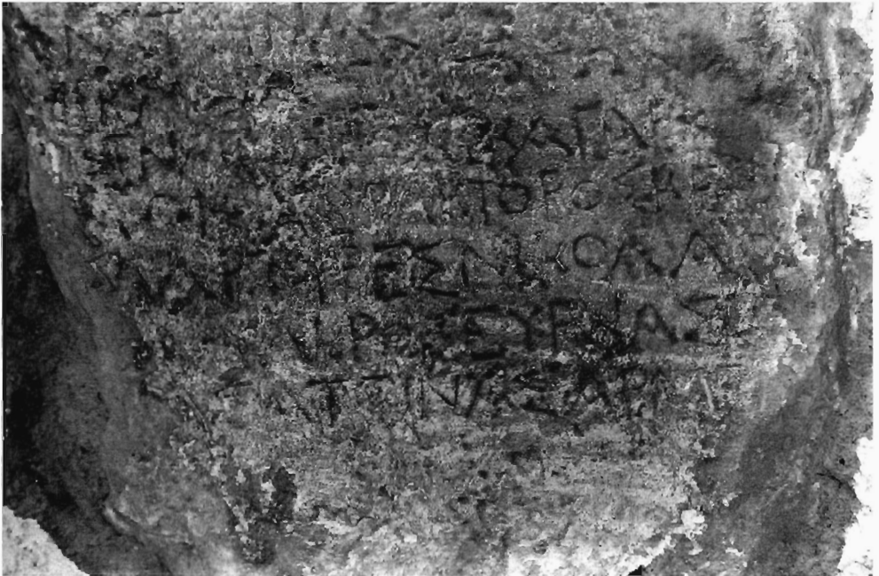
Π. Χρυσστόμου Ειζ. 5