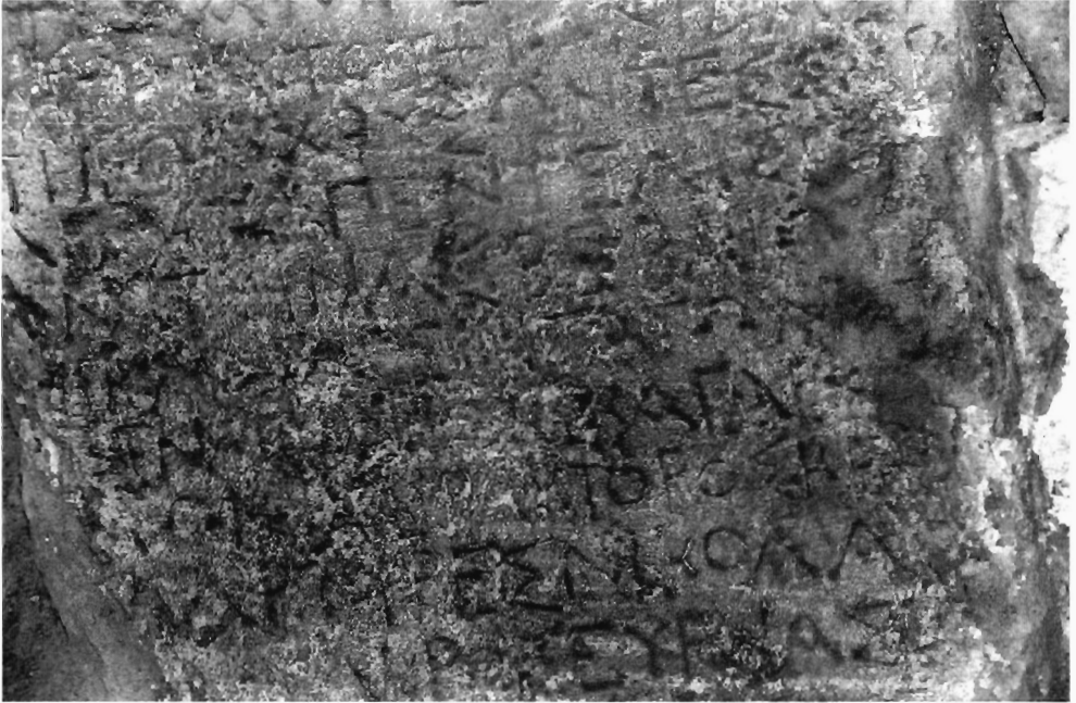
Π. Χρυσστόμου Ειζ. 4