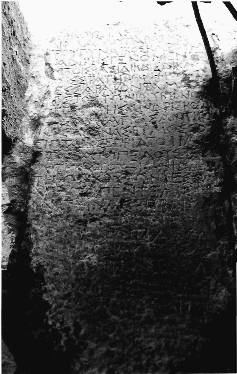
Π. Χρυσόστομου Ειζ. 1