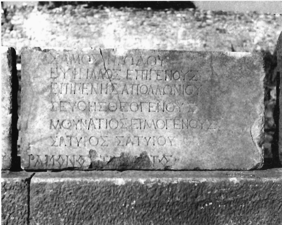
M.-G. Parissaki, Fig. 3