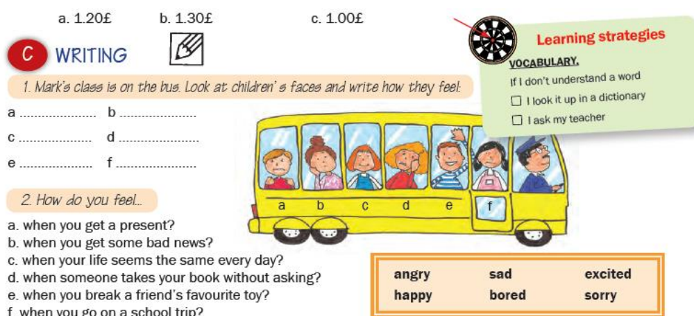
Εικόνα 1: Η εικόνα του βιβλίου που επαυξήθηκε μέσω της εφαρμογής

εκπαιδευτικό, ενώ η άσκηση, που ασχολείται με το ενδιαφέρον και πρόσφορο για διδασκαλία αντικείμενο των συναισθημάτων, δεν πετυχαίνει να τραβήξει το ενδιαφέρον των μαθητών.