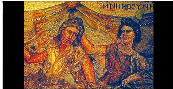
Εικ. 2: Ψηφιδωτό Μνημοσύνης στο ντοκιμαντέρ

Τα στάδια εφαρμογής της δράσης ήταν τα ακόλουθα: