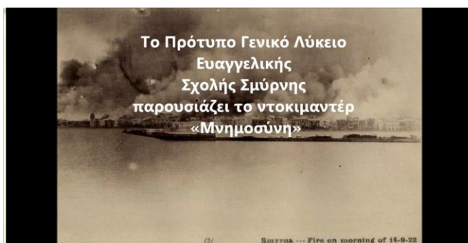
Εικ. 1: Τίτλοι έναρξης ντοκιμαντέρ