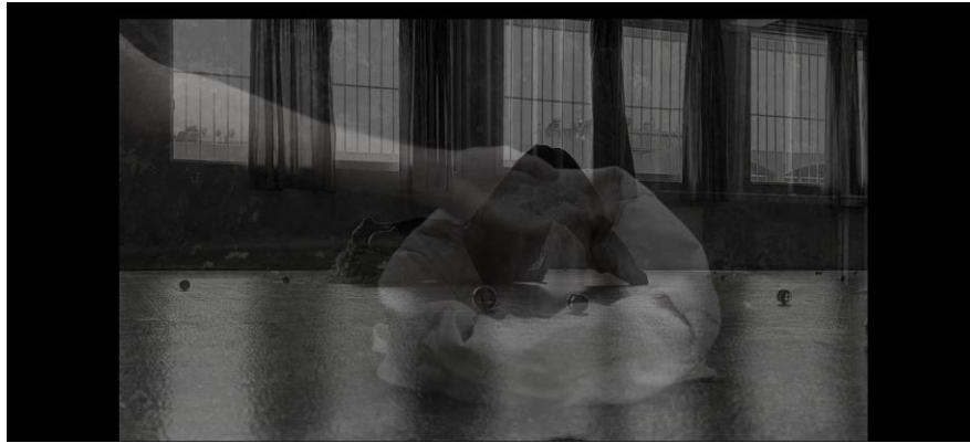
Εικ. 3: Μοντάζ καλλιτεχνικού βίντεο

Όσον αφορά τον αντίκτυπο της δράσης τόσο στη σχολική κοινότητα όσο και στην ευρύτερη κοινωνία, τέθηκαν ως στόχοι α) η γνωριμία των μαθητών και των μαθητριών με μία πλευρά της σύγχρονης ιστορίας, β) η καλλιέργεια του σεβασμού των συμμετεχόντων για τη διαφορετικότητα, γ) η βελτίωση του οπτικοακουστικού γραμματισμού των συμμετεχόντων και δ) η καλλιέργεια κριτικής σκέψης και δημιουργικότητας των μαθητών και των μαθητριών. Η υλοποίηση της δράσης αξιολογήθηκε εκτός από την εκπλήρωση των στόχων του διαγωνισμού, από την ενεργό συμμετοχή των μαθητών και των μαθητριών, την τήρηση του χρονοδιαγράμματος, το οποίο αποδείχτηκε το πιο απαιτητικό μέρος της δράσης, κυρίως λόγω του εγκλεισμού και της μη δια ζώσης επαφής των συμμετεχόντων με την επιβλέπουσα εκπαιδευτικό, την ποιότητα του παραδοτέου βίντεο και το αποτέλεσμα του διαγωνισμού.