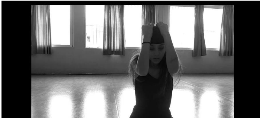
Εικ. 2: Στιγμιότυπο από τη διαμεσολαβούμενη χορογραφία

εκπαιδευτικού, ενώ όλοι οι παρόντες είχαν υποβληθεί σε ατομικό τεστ για τον Covid-19 και τηρήθηκαν αυστηρά τα μέτρα προστασίας κατά του κορονοϊού. Αρχικά, οι συμμετέχοντες αποφάσισαν την πτυχή του Ολοκαυτώματος που θα εξέταζαν. Με αφορμή μία αναφορά στην εξέγερση του Άουσβιτς που γίνεται στο βιβλίο «Ισαάκ Μιζάν: Αριθμός Βραχίονα 182641» (Βλαχοπάνος, 2017), αποφασίστηκε να εστιάσουν σε ένα περιστατικό που ήταν άγνωστο στους συμμετέχοντες και δήλωνε την ενεργητική στάση των κρατούμενων Εβραίων και τον αγώνα τους για ελευθερία και μέσα στις συνθήκες κράτησης των στρατοπέδων εξόντωσης. Έτσι ξεκίνησε αναζήτηση αρχειακού υλικού που να σχετίζεται με το γεγονός αυτό. Όταν είχε δομηθεί η αφήγηση, δύο μαθητές έγραψαν τη μουσική, και είναι αξιοσημείωτο ότι η σύνθεση και εκτέλεσή της υλοποιήθηκε εξ αποστάσεως, λόγω του εγκλεισμού, με τη χρήση ψηφιακών τεχνολογικών εργαλείων. Ακολούθησε ο σχεδιασμός και η εκτέλεση της χορογραφίας από μία μαθήτρια, και η δημιουργία του ντεκουπάζ. Τα γυρίσματα έγιναν στο χώρο του σχολείου καθώς και σε δύο εξωτερικούς χώρους με την άδεια των γονέων και κηδεμόνων των μαθητών και μαθητριών και του διευθυντή του σχολείου. Για την ονομασία του βίντεο έμπνευση αποτέλεσαν τα λόγια του Έλληνα Εβραίου επιζώντα του Άουσβιτς που έζησε την εξέγερση Μαρσέλ Νατζαρί, «Έστω και διά ολίγα λεπτά ευρέθησαν ελεύθεροι».