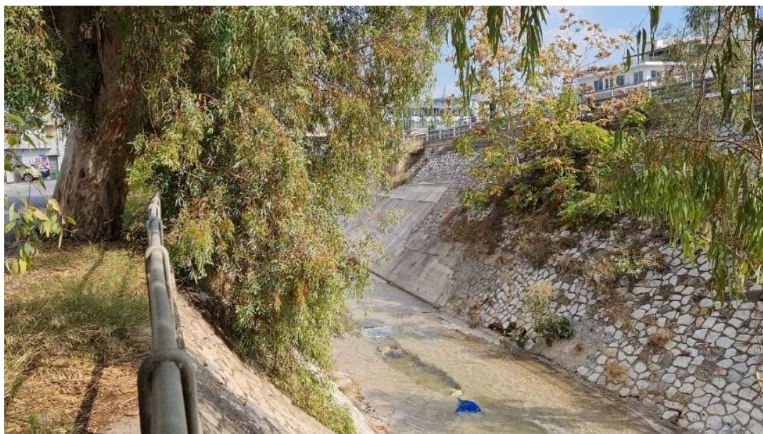
Εικόνα 6 «Στο πλάνο ο Κηφισός αντιστέκεται λίγο ακόμα, στέκοντας περήφανος δίπλα στην εθνική οδό, σύμβολο της νεωτερικότητας. Δύο διαφορετικοί χωροχρόνοι δίπλα δίπλα, ο ένας δείχνει τη φυσική ροή της ζωής και ο άλλος την φρενήρη και θορυβώδη

Το τρίτο παράδειγμα, το οποίο σχετίζεται με την περιβαλλοντική ευαισθητοποίηση, αποτελεί η κινηματογράφηση της φυσικής πολιτιστικής κληρονομιάς και των εναπομεινάντων φυσικών χώρων, καθώς και η νοηματοδότησή τους ως τόπων ιερών. Ο αρχαίος ποταμός Κηφισός και η αιωνόβια Ελιά του Πεισίστρατου (εικόνες 6-8) συνδέουν το αρχαίο παρελθόν με το μετανεωτερικό παρόν και αποτελούν σημεία αναφοράς για την περιοχή και τους κατοίκους. Παρατηρώντας τα φυσικά αυτά τοπία θαυμάζει κανείς την ομορφιά και την δύναμη της φύσης και αισθάνεται ότι αποτελεί χρέος η προστασία και η διατήρησή τους για τις επόμενες γενιές στο μέλλον. Παράλληλα προβληματίζεται κανείς για την ρύπανση του περιβάλλοντος ή την αντίθεση ανάμεσα στον ρυθμό της φύσης και της καπιταλιστικής πόλης.