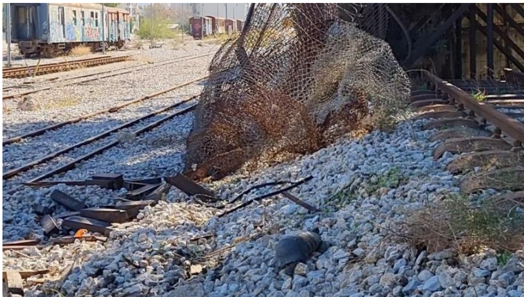
Εικόνα 2 «Η απρόσμενη συνάντηση μιας χελώνας μου υπενθύμισε ότι σε αυτό το σημείο της πόλης ο ρυθμός της ζωής είναι διαφορετικός. Μου ήρθε στο μυαλό ο πλάνητας του Βενιαμίν στο Παρίσι του 19 ου αιώνα, ο οποίος ακολουθεί το ρυθμό μιας χελώνας, για να αντισταθεί στην υποτιθέμενη πρόοδο και τον πυρετώδη ρυθμό του καπιταλιστικού τρόπου ζωής.» (απόσπασμα από την ταινία της γράφουσας)