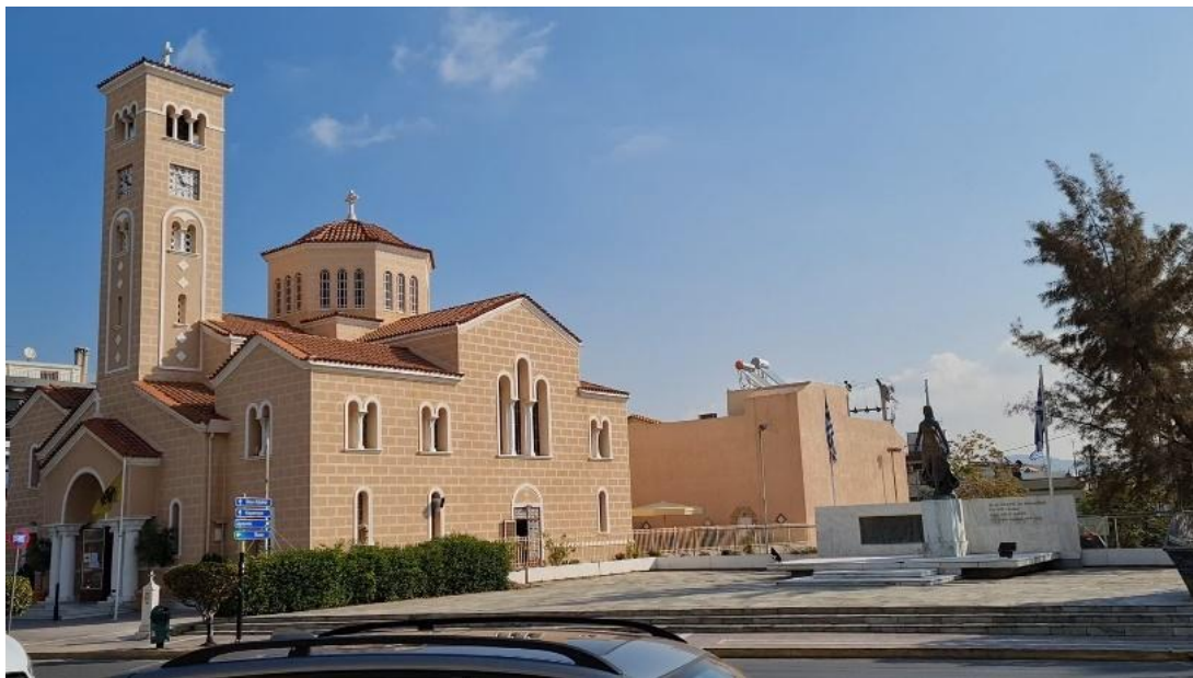
Εικόνα 5 «Τα εκκλησάκια αυτά, που εντοπίζονται στον χάρτη του Kaupert, και έχουν ερευνηθεί από τον Ορλάνδο, είναι σημεία αναφοράς για τους κατοίκους. Πόσο μάλλον η εκκλησία των Αγίων Αναργύρων, η οποία είναι η καρδιά της περιοχής. Από τους Αγίους Κοσμά και Δαμιανό, πήρε το όνομά της όλη η περιοχή. Εδώ γιορτάστηκε και η ίδρυση των Αγίων Αναργύρων το 1927. Η θρησκεία συνυφασμένη με την λαϊκή παράδοση μας φέρνει στο μυαλό πολλές αναμνήσεις, γιορτές, ήθη και έθιμα, χαρές και λύπες» (απόσπασμα από την ταινία της γράφουσας)