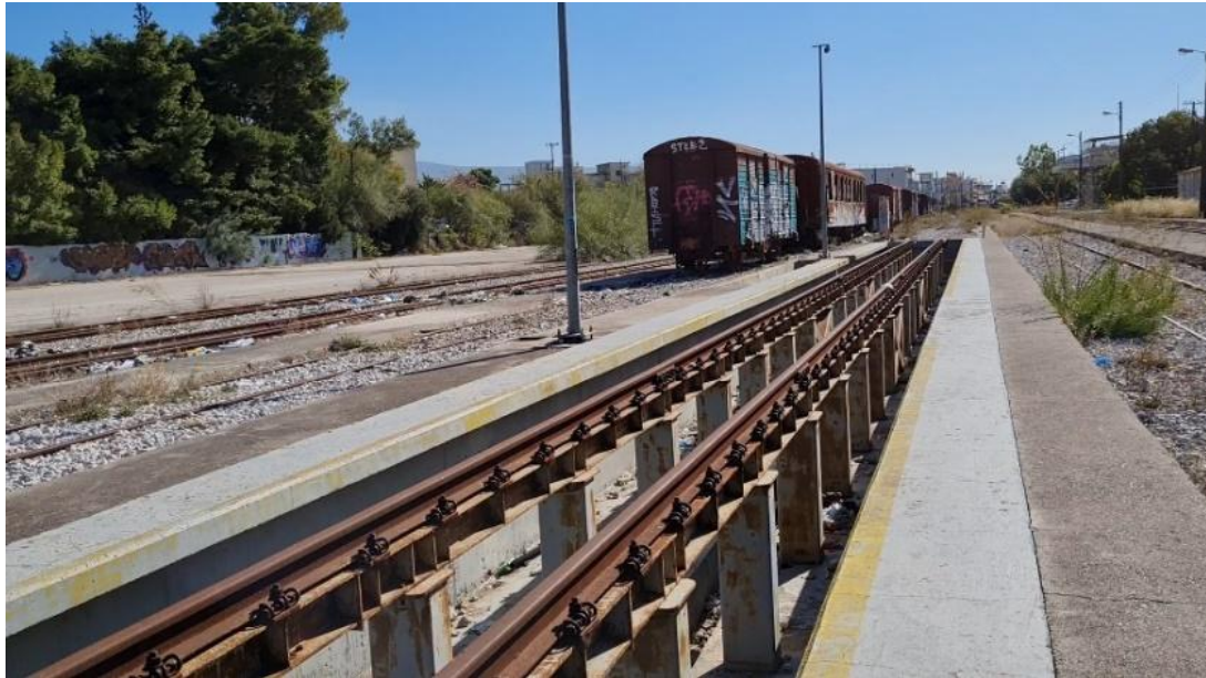
Εικόνα 1 Ο εγκαταλελειμμένος σταθμός του τρένου στους Αγίους Αναργύρους. «Το 1884 πέρασε από εδώ η πρώτη γραμμή Πειραιά-Αθηνών-Πελοποννήσου, εν συντομία ΣΠΑΠ, και το 1904 η δεύτερη γραμμή, ΣΕΚ ή Λαρισσαϊκός, όπως αναφέρει ο Ανδρέας Μηλιώνης στο βιβλίο του για τους Αγίους Αναργύρους.» (απόσπασμα από την ταινία της γράφουσας)