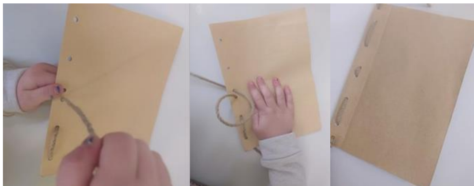
Εικόνα 5: «Βιβλιοδεσία»