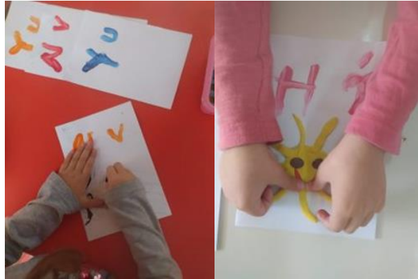
Εικόνα 3: «Κολάζ»