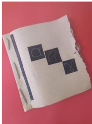
Εικόνα 4: «Εξώφυλλο»

Δημιουργούν το εξώφυλλο και το οπισθόφυλλο του βιβλίου τους και το διακοσμούν.