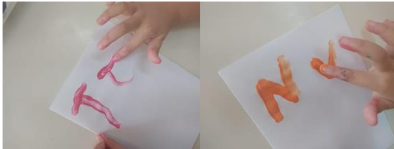
Εικόνα 1: «Σχεδιάζουν γράμματα»

Χρησιμοποιώντας τέμπερα, σχεδιάζουν με το χέρι τους ένα ένα τα γράμματα του ονόματός τους σε λευκό χαρτί.