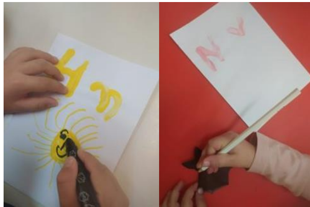
Εικόνα 2: «Ζωγραφίζουν αντικείμενα»

Για κάθε ένα από τα γράμματα, με τα οποία γράφεται το όνομά τους, ζωγραφίζουν ένα αντικείμενο της αρεσκείας τους, που αρχίζει με το γράμμα αυτό.