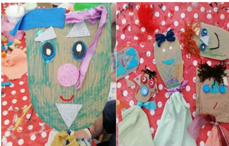
Εικόνα 2: «Μικρές μαρότες σύνθεση ετερόκλητων υλικών»