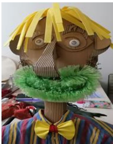
Εικόνα 1: « Γιγαντόκουκλα, ο κύριος Πατσαβουράκης»

Κούκλες από τα μαθήματα στο ΚΔΑΠ ΑμεΑ Διάπλασις, Καλαμάτα