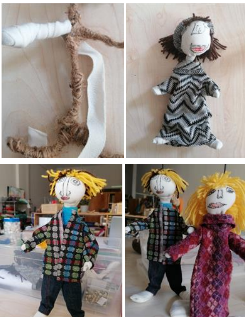
Εικόνα 4: «Κούκλες φτιαγμένες από σύρμα και ύφασμα»