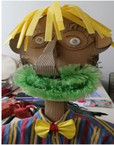
Εικόνα 1: « Γιγαντόκουκλα, ο κύριος Πατσαβουράκης»

Κούκλες από τα μαθήματα στο ΚΔΑΠ ΑμεΑ Διάπλασις, Καλαμάτα