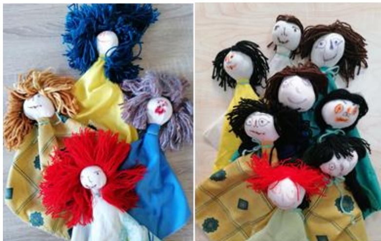
Εικόνα 3: «Μαρότες μικρές από ύφασμα και γέμισμα βαμβάκι, όπως έφτιαχναν παλιά τις κούκλες»