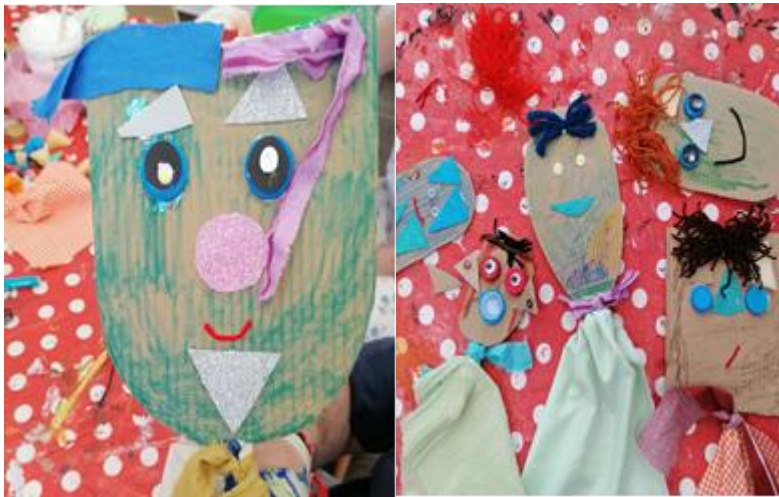
Εικόνα 2: «Μικρές μαρότες σύνθεση ετερόκλητων υλικών»