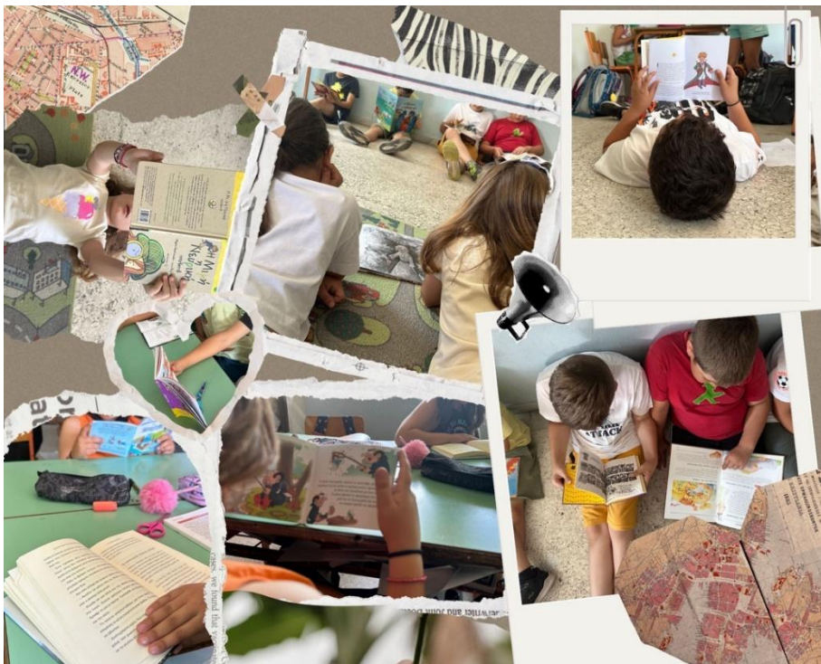
Εικόνα 2: Στιγμές από τη λέσχη ανάγνωσης της τάξης

σκέψη τους και δραπετεύουν από τον κόσμο των ενηλίκων. Η εκπαιδευτικός της τάξης διάβαζε μαζί με τα παιδιά το δικό της βιβλίο κατά τη διάρκεια της λέσχης ανάγνωσης, κάτι ιδιαίτερα σημαντικό καθώς το τι επιλέγει να κάνει μία εκπαιδευτικός αποτελεί παράδειγμα προς μίμηση (Τσιρώνη, 2014). Τα βιβλία αυτά διαβάζονταν τόσο κατά τη διάρκεια του σχολικού ωραρίου όσο και αυτόνομα στο σπίτι, στον προσωπικό χρόνο των μαθητών και των μαθητριών. Η λέσχη ανάγνωσης ήταν η αφετηρία για πλούσιες και δημιουργικές συζητήσεις. Μέσα από τα βιβλία που αγαπήθηκαν στη λέσχη ανάγνωσης, οι μαθητές κι οι μαθήτριες δημιούργησαν παιχνίδια ρόλων, συνέθεσαν δικές τους ιστορίες και συμμετείχαν σε συζητήσεις, μετατρέποντας την τάξη σε μια ζωντανή σκηνή δημιουργικότητας και φαντασίας.