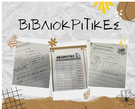
Εικόνα 1: Εικόνες από τη γωνιά της τάξης με τις βιβλιοκριτικές

Ένα από τα θέματα που δημιουργήθηκαν από την αρχή της δράσης ήταν πού θα βρίσκουμε τα βιβλία. Το θέμα συζητήθηκε στο συμβούλιο της τάξης και προτάθηκε να γίνεται ανταλλαγή βιβλίων μεταξύ των μαθητών και των μαθητριών. Στη συνέχεια με την επίσκεψή μας στη Δημόσια Κεντρική Βιβλιοθήκη Καλαμάτας ενημερωθήκαμε ότι υπάρχει η δυνατότητα να δανειζόμαστε βιβλία, κάτι που αξιοποιήθηκε από ορισμένους μαθητές και μαθήτριες. Επιπλέον, η επίσκεψη αυτή μας βοήθησε να συγκεντρώσουμε βιβλιοθηκονομικές πληροφορίες και να μάθουμε για τον τρόπο ταξινόμησης των βιβλίων. Η τακτική ανάγνωση επιλεγμένων βιβλίων μαζί με τους μαθητές και τις μαθήτριες σε συνδυασμό με όλες αυτές τις δράσεις, κατέστησαν την εκπαιδευτική μας προσέγγιση μια ολοκληρωμένη εμπειρία μάθησης με θετικά αποτελέσματα, τόσο στην ακαδημαϊκή, όσο και στην προσωπική ανάπτυξη των παιδιών.