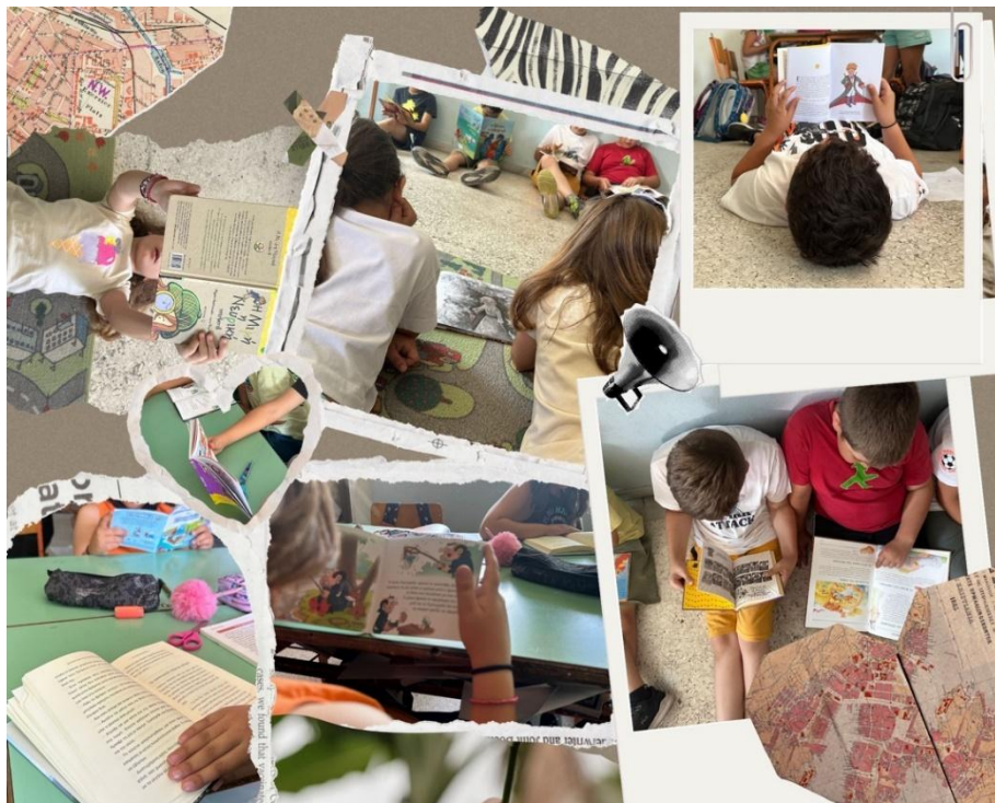
Εικόνα 2: Στιγμές από τη λέσχη ανάγνωσης της τάξης

σκέψη τους και δραπετεύουν από τον κόσμο των ενηλίκων. Η εκπαιδευτικός της τάξης διάβαζε μαζί με τα παιδιά το δικό της βιβλίο κατά τη διάρκεια της λέσχης ανάγνωσης, κάτι ιδιαίτερα σημαντικό καθώς το τι επιλέγει να κάνει μία εκπαιδευτικός αποτελεί παράδειγμα προς μίμηση (Τσιρώνη, 2014). Τα βιβλία αυτά διαβάζονταν τόσο κατά τη διάρκεια του σχολικού ωραρίου όσο και αυτόνομα στο σπίτι, στον προσωπικό χρόνο των μαθητών και των μαθητριών. Η λέσχη ανάγνωσης ήταν η αφετηρία για πλούσιες και δημιουργικές συζητήσεις. Μέσα από τα βιβλία που αγαπήθηκαν στη λέσχη ανάγνωσης, οι μαθητές κι οι μαθήτριες δημιούργησαν παιχνίδια ρόλων, συνέθεσαν δικές τους ιστορίες και συμμετείχαν σε συζητήσεις, μετατρέποντας την τάξη σε μια ζωντανή σκηνή δημιουργικότητας και φαντασίας.