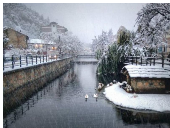
Ποταμός Σακουλέβας στη χιονισμένη Φλώρινα

"Είναι το βουητό της ιστορίας που κατρακυλάει με ματωμένα αμπέχονα;", ρωτάω.