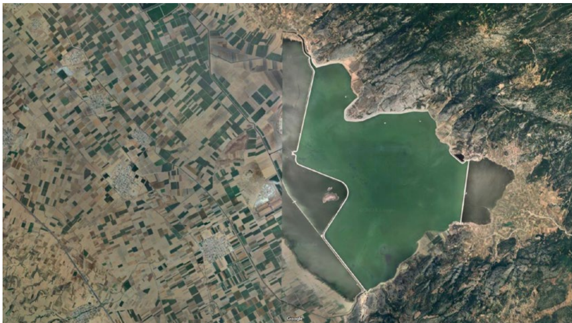
Εικόνα 2: Στιγμιότυπο οθόνης από περιήγηση στην πλατφόρμα Google Maps πάνω από την ίμνη Κάρλα (Τελευταία Ενημέρωση: 15 Ιανουαρίου 2025)

Τέλος, η επιρροή αυτών των ορίων φαίνεται πως εκφράζεται διαντικειμενικά – γίνεται, δηλαδή, ανιχνεύσιμη σε έναν τόπο διασυνδέσεων μεταξύ αισθητικών ιδιοτήτων άλλων αντι-