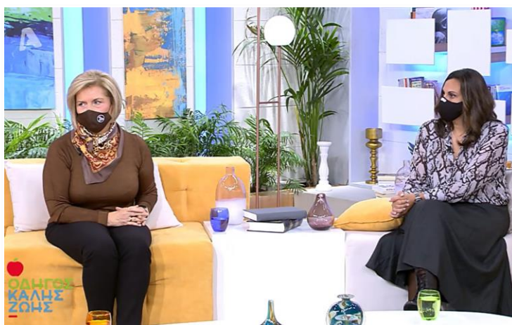
[7] Τα συμπτώματα, η μοναξιά, η συμπαράσταση των φίλων (ΟΔΗΓΟΣ ΚΑΛΗΣ ΖΩΗΣ, ALPHA, 12.12.2020)