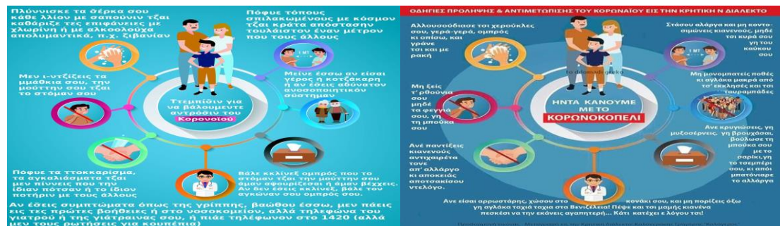
Εικόνες 1, 2. Οδηγίες για τον κορονοϊό στην κυπριακή διάλεκτο και το κρητικό ιδίωμα.

νεοελληνικής. Παράλληλα, αποτελεί ένα πρώτης τάξεως εκπαιδευτικό υλικό στο πλαίσιο της διδασκαλίας των διαλέκτων υπό το πρίσμα του κριτικού γραμματισμού (βλ. μεταξύ άλλων για τη διδασκαλία των διαλέκτων και τον ρόλο των μέσων μαζικής κουλτούρας σε αυτή Ντίνας & Ζαρκογιάννη 2009· Στάμου & Ντίνας 2011· Androutsopoulos (επιμ.) 2014· Τζακώστα (επιμ.) 2015· Στάμου, Πολίτης και Αρχάκης (επιμ.) 2016· Fterniati, Tsami & Archakis 2020).