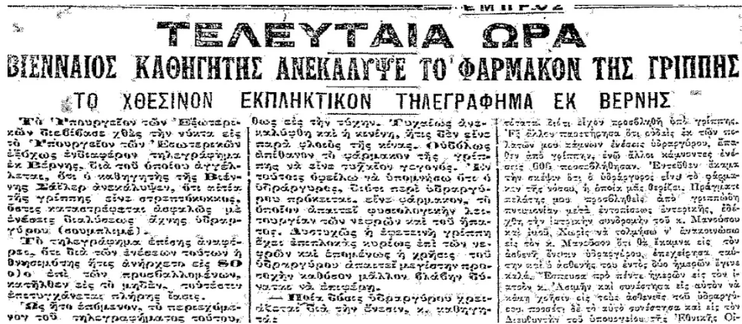
Εικόνα 3. Απόσπασμα εφημερίδας για την εύρεση του φαρμάκου της ισπανικής γρίπης

Παράλληλα, στην ισπανική γρίπη το επίμαχο γλωσσικό θέμα ήταν αν η γρίπη θα πρέπει να γράφεται με ένα με δύο π. Αν και σε όλες οι εφημερίδες το έγγραφαν γρίπη (βλ. εικόνα 3), σε ένα δημοσίευμα του Ριζοσπάστη (24 Ιουνίου 1918) υπάρχει σε παρένθεση ως διευκρίνιση το δάνειο γκριπ ινφλουέντζα . Σήμερα, μετά το πέρασμα των δεκαετιών, κανείς πλέον δεν χρησιμοποιεί τη λέξη ινφλουέντζα ούτε τίθεται θέμα ορθογραφίας της λέξης γρίπη . Χαρακτηριστική είναι η παρακάτω αναφορά στην εφημερίδα Ακρόπολη :