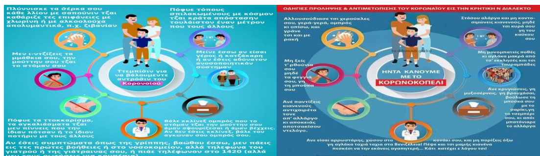
Εικόνες 1, 2. Οδηγίες για τον κορονοϊό στην κυπριακή διάλεκτο και το κρητικό ιδίωμα.

νεοελληνικής. Παράλληλα, αποτελεί ένα πρώτης τάξεως εκπαιδευτικό υλικό στο πλαίσιο της διδασκαλίας των διαλέκτων υπό το πρίσμα του κριτικού γραμματισμού (βλ. μεταξύ άλλων για τη διδασκαλία των διαλέκτων και τον ρόλο των μέσων μαζικής κουλτούρας σε αυτή Ντίνας & Ζαρκογιάννη 2009· Στάμου & Ντίνας 2011· Androutsopoulos (επιμ.) 2014· Τζακώστα (επιμ.) 2015· Στάμου, Πολίτης και Αρχάκης (επιμ.) 2016· Fterniati, Tsami & Archakis 2020).