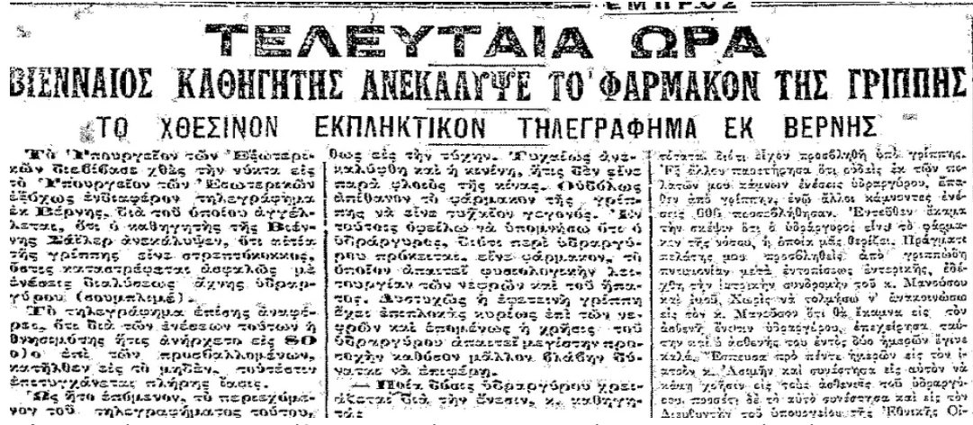
Εικόνα 3. Απόσπασμα εφημερίδας για την εύρεση του φαρμάκου της ισπανικής γρίπης

Παράλληλα, στην ισπανική γρίπη το επίμαχο γλωσσικό θέμα ήταν αν η γρίπη θα πρέπει να γράφεται με ένα με δύο π. Αν και σε όλες οι εφημερίδες το έγγραφαν γρίπη (βλ. εικόνα 3), σε ένα δημοσίευμα του Ριζοσπάστη (24 Ιουνίου 1918) υπάρχει σε παρένθεση ως διευκρίνιση το δάνειο γκριπ ινφλουέντζα . Σήμερα, μετά το πέρασμα των δεκαετιών, κανείς πλέον δεν χρησιμοποιεί τη λέξη ινφλουέντζα ούτε τίθεται θέμα ορθογραφίας της λέξης γρίπη . Χαρακτηριστική είναι η παρακάτω αναφορά στην εφημερίδα Ακρόπολη :