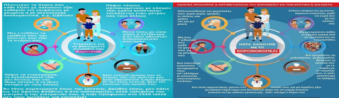
Εικόνες 1, 2. Οδηγίες για τον κορονοϊό στην κυπριακή διάλεκτο και το κρητικό ιδίωμα.

νεοελληνικής. Παράλληλα, αποτελεί ένα πρώτης τάξεως εκπαιδευτικό υλικό στο πλαίσιο της διδασκαλίας των διαλέκτων υπό το πρίσμα του κριτικού γραμματισμού (βλ. μεταξύ άλλων για τη διδασκαλία των διαλέκτων και τον ρόλο των μέσων μαζικής κουλτούρας σε αυτή Ντίνας & Ζαρκογιάννη 2009· Στάμου & Ντίνας 2011· Androutsopoulos (επιμ.) 2014· Τζακώστα (επιμ.) 2015· Στάμου, Πολίτης και Αρχάκης (επιμ.) 2016· Fterniati, Tsami & Archakis 2020).