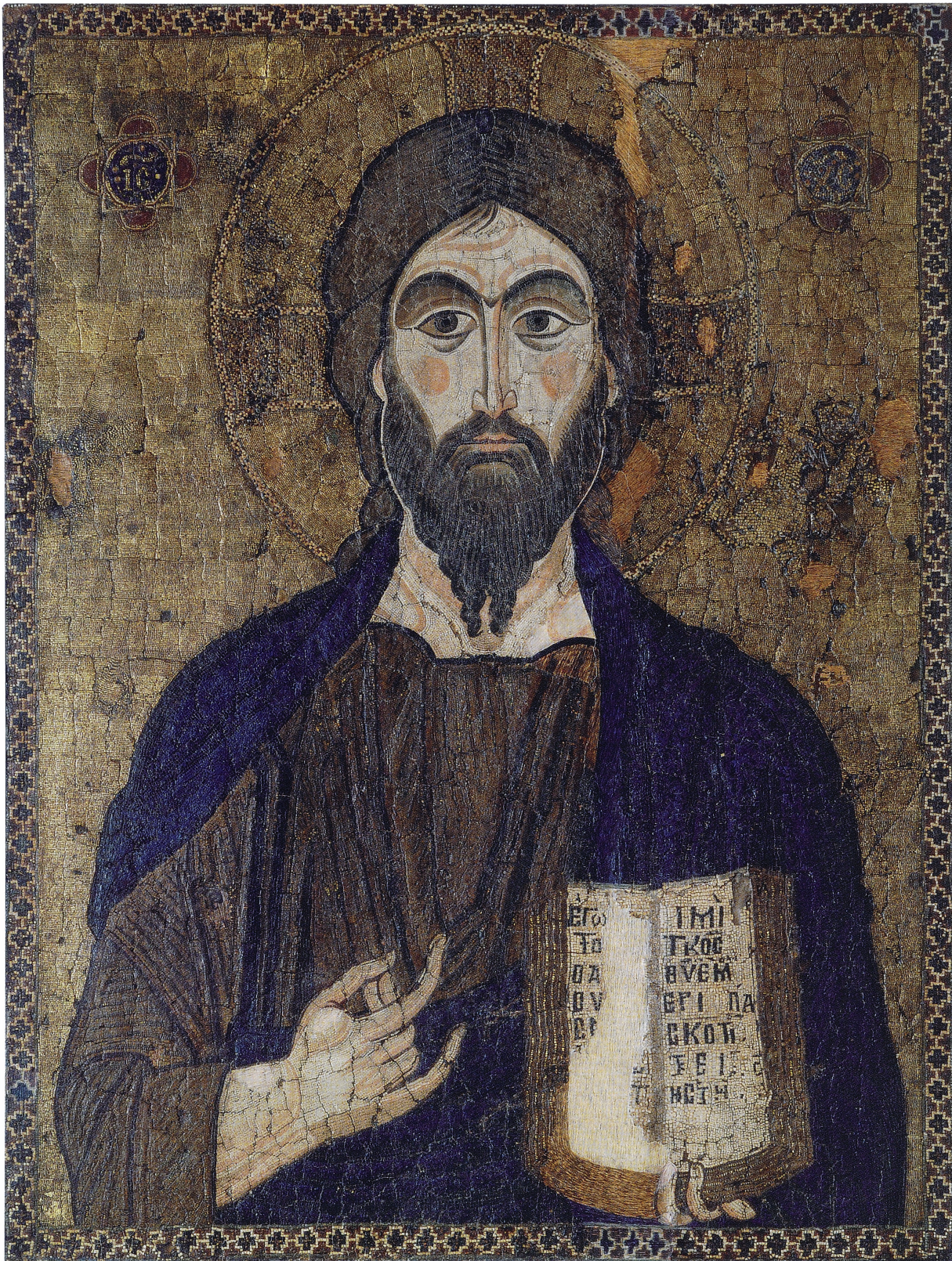
Εικ. 14. Ψηφιδωτή εικόνα με παράσταση του Χριστού Παντοκράτορα, 1150-1175. Φλωρεντία, Museo Nazionale di Bargello, αρ. ευρ. 3.