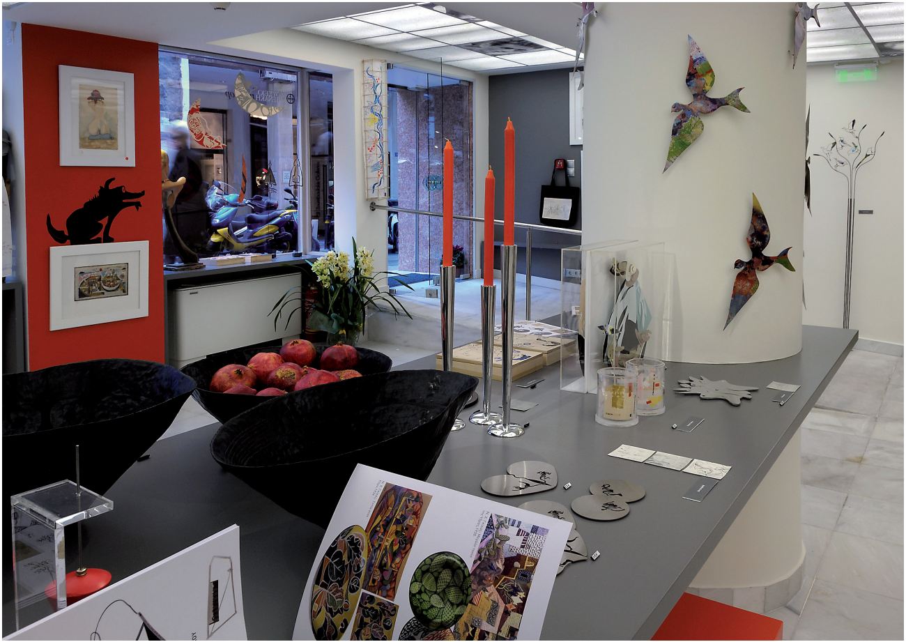
Εικ. 15. Άποψη του Πωλητηρίου. Μουσείο Μπενάκη - Πινακοθήκη Ν. Χατζηκυριάκου-Γκίκα.