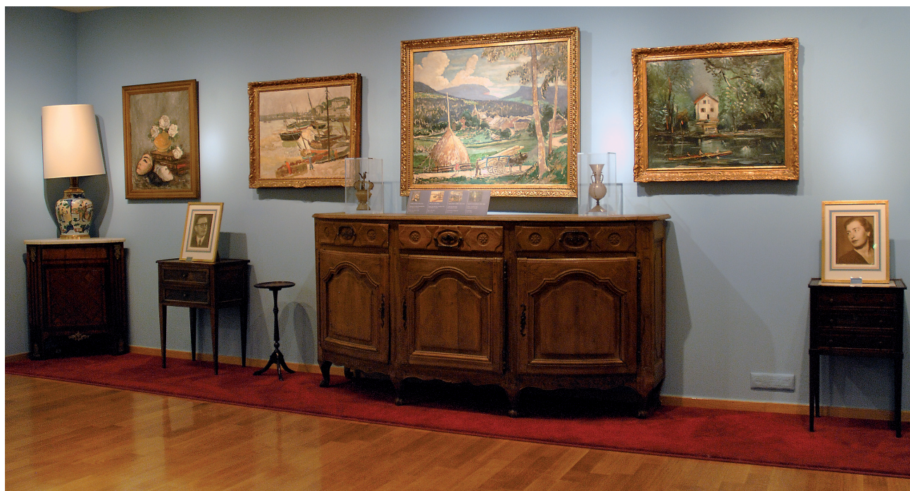
Εικ. 8. Αίθουσα της δωρεάς Παπασπύρου με έργα των Pierre Laprade, Jean Puy, Jules Léon Flandrin, Maurice De Vlaminck. Μουσείο Μπενάκη - Πινακοθήκη Ν. Χατζηκυριάκου-Γκίκα, ισόγειο.