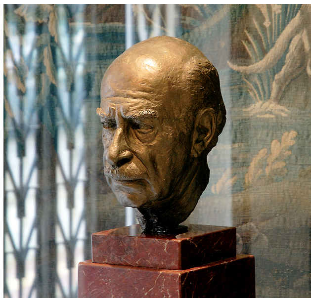
Εικ. 7. Η προτομή του Γκίκα από τον γλύπτη Πραξιτέλη Τζανουλίνο. Μουσείο Μπενάκη - Πινακοθήκη Ν. Χατζηκυριάκου-Γκίκα, είσοδος.

κούρη, Ι. Καμπανέλλης, Μ. Πλωρίτης, Δ. Χορν και Μ. Κακογιάννης. Στο Θέατρο βρίσκεται εντεταγμένος και ο Σωτήρης Σπαθάρης, ανάμεσα σε συγγραφείς, σκηνοθέτες, κριτικούς, όχι όμως και σε όσους θα έπρεπε από τους πιο προβεβλημένους τότε ηθοποιούς. Γιατί ενώ η Κυβέλη, η Ελένη Παπαδάκη και κάποιοι άλλοι πρωταγωνιστές διακρίνονται σε ορισμένες φωτογραφικές επιλογές θεατρικών παραστάσεων, απουσιάζουν οι έστω και πλάγιες αναφορές στον Αιμίλιο Βεάκη λ.χ. ή στους μεγάλους κωμικούς της επιθεώρησης.