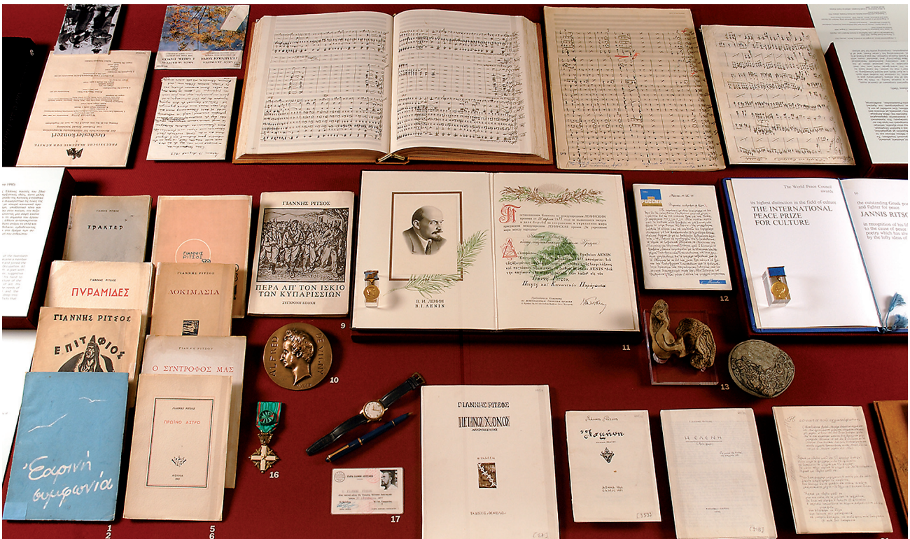
Εικ. 10. Άποψη της προθήκης με αρχαικό υλικό των Γ. Ρίτσου και Ν. Σκαλκώτα. Μουσείο Μπενάκη - Πινακοθήκη Ν. Χατζηκυριάκου-Γκίκα, 1ος όροφος.