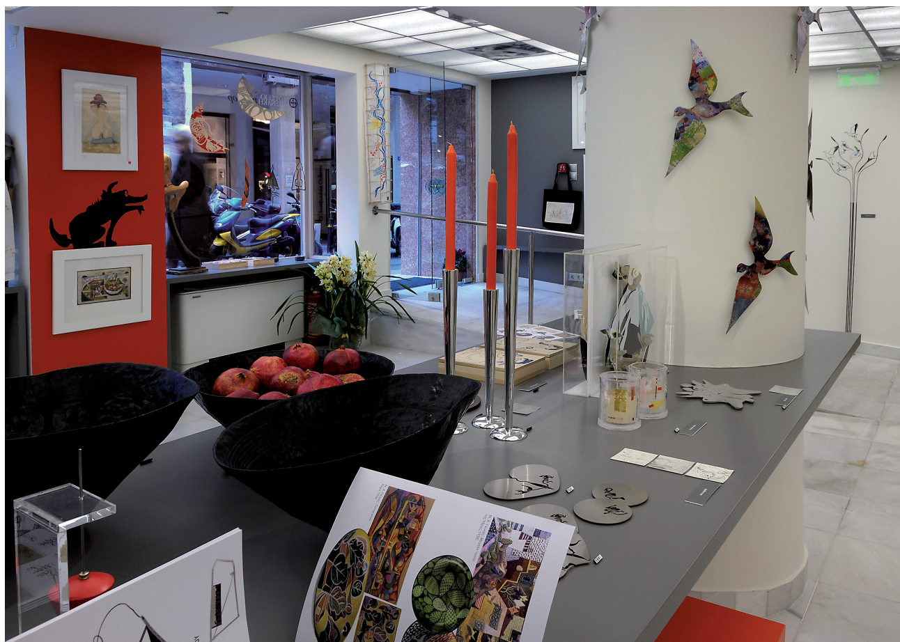
Εικ. 15. Άποψη του Πωλητηρίου. Μουσείο Μπενάκη - Πινακοθήκη Ν. Χατζηκυριάκου-Γκίκα.

κής ροής, θα ήταν όμως ανέφικτη χωρίς τις πάμπολλες, συγκινητικά πρόθυμες δωρεές. Χωρίς δηλαδή τα αντικείμενα τα οποία μας πρόσφεραν φίλοι, γνωστοί και συλλέκτες, συγγενείς αλλά και άμεσοι απόγονοι όσων εκπροσωπούνται. Την ευγνωμοσύνη μου, καθώς και την ευγνωμοσύνη του Μουσείου Μπενάκη για τη γενναιοδωρία τους δεν την αναπληρώνει βεβαίως η απλή μνεία των ονομάτων τους. 11 Το ίδιο ισχύει για αρκετές ανεκτίμητες παρακαταθήκες Ιδρυμάτων και Εταιρειών, 12 και για πολλά εξίσου πολύτιμα δάνεια ιδιωτών. 13 Οφείλω ακόμα να μνημονεύσω τις άφθονες μαρτυρίες που προέρχονται από κατατεθειμένους στο Μουσείο Μπενάκη θησαυρούς: τα φωτογραφικά αρχεία της Βούλας Παπαϊωάννου, της Nelly's, του Δημήτρη Χαρισιάδη και του Κώστα Μπαλάφα, τα αρχιτεκτονικά αρχεία των Δημήτρη Πικιώνη και Ντίνου Δοξιάδη, τις βιβλιοθήκες του