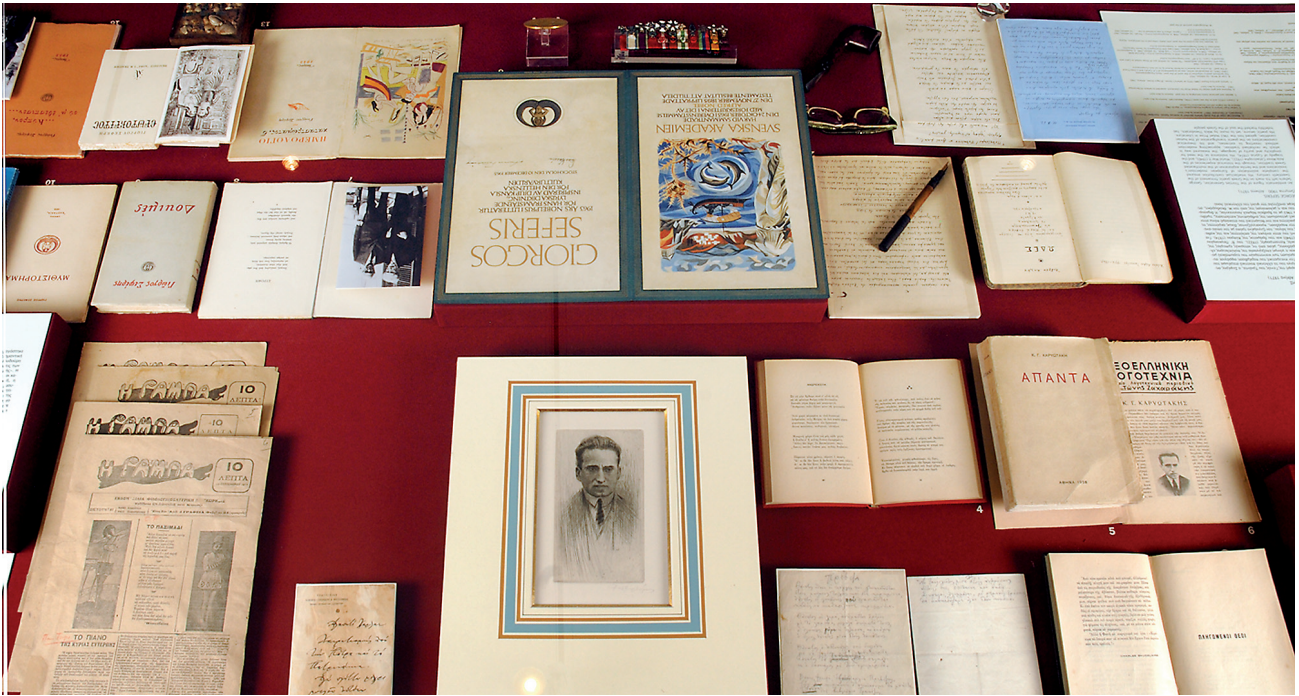
Εικ. 9. Άποψη της προθήκης με αρχαικό υλικό των Κ. Καρυωτάκη και Γ. Σεφέρη. Μουσείο Μπενάκη - Πινακοθήκη Ν. Χατζηκυριάκου-Γκίκα, ισόγειο.