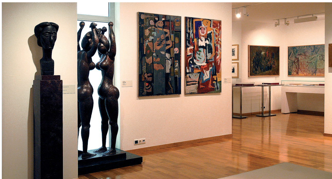
Εικ. 13. Άποψη της αίθουσας με έργα των Κ. Μακρή, Γ. Μαυροΐδη και Β. Σεμερτζίδα. Μουσείο Μπενάκη - Πινακοθήκη Ν. Χατζηκυριάκου-Γκίκα, 2ος όροφος.

ϊωάννου και η Nelly's, οι Σ. Μελετζής, Δ. Χαρισιάδης, Τ. Τλούπας και Κ. Μπαλάφας.