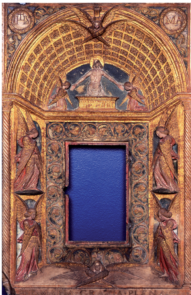
Εικ. 11. Επιτοίχια πρόσοψη εντοίχιου αρτοφορίου για την αποθήκευση της όστιας με τον Χριστό Άκρα Ταπείνωση σε σαρκοφάγο και αγγέλους, 1475-1500. Σικάγο, The David and Alfred Smart Museum of Art, Chicago University, Gift of the Samuel H. Kress Foundation (1973-55).