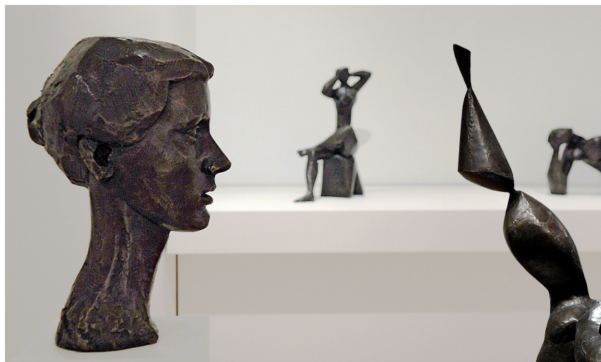
Αποψη της έκθεσης Κώστας Κουλεντιανός στο κτήριο της οδού Πειραιώς.

στη διαμόρφωση του ύφους της νεο-ελληνικής αρχιτεκτονικής.