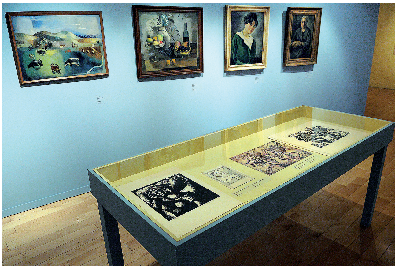
Άποψη της έκθεσης Αγνήνωρ Αστεριάδης στο κτήριο της οδού Πειραιώς (φωτ.: Λ. Κουργιαντάκης).

□ Αγνήνωρ Αστεριάδης 1898-1977 23 Σεπτεμβρίου - 20 Νοεμβρίου 2011 Επιμέλεια έκθεσης: Ειρήνη Οράτη Διοργάνωση: Μουσείο Μπενάκη