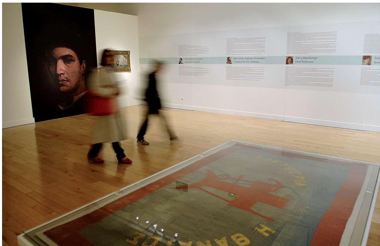
Άποψη της έκθεσης Ιωάννης Αλταμούρας στο κτήριο της οδού Πειραιώς.

Υπουργείου Περιβάλλοντος, Ενέργειας και Κλιματικής Αλλαγής. Σκοπός του Διαγωνισμού ήταν η αναζήτηση προτάσεων για το Οικοδομικό Τετράγωνο, το βασικό κύτταρο της πόλης. Οι συμμετέχοντες μπορούσαν να επιλέξουν τέσσερα τυπικά οικοδομικά τετράγωνα σε γειτονίες του λεκανοπεδίου Αττικής με υποβαθμισμένο αστικό περιβάλλον και να καταθέσουν Πρόταση για την αξιοποίηση του λεγόμενου “σταυρού”, των ενδιάμεσων δηλαδή δρόμων, συνδυάζοντάς τους με υφιστάμενα κενά ή ακάλυπτους χώρους.