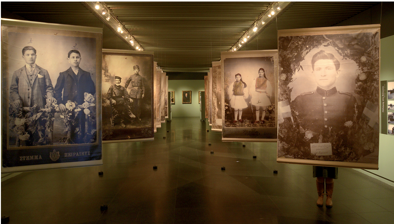
Αποψη της έκθεσης Βαλκανικοί Πόλεμοι 1912-1913 στο κεντρικό κτήριο.

στηκαν μεταξύ άλλων στην έκθεση, έθεσαν εκ νέου το ζήτημα της σύνδεσης της αργυροχοΐας με την καλλιτεχνική δημιουργία. Η έκθεση, η οποία είχε ήδη παρουσιαστεί στη Γαλλία και στις ΗΠΑ, πλαισιώθηκε στην ελληνική διοργάνωση από έργα Ελλήνων δημιουργών που είχαν πειραματιστεί με τη φόρμα του κοσμήματος.