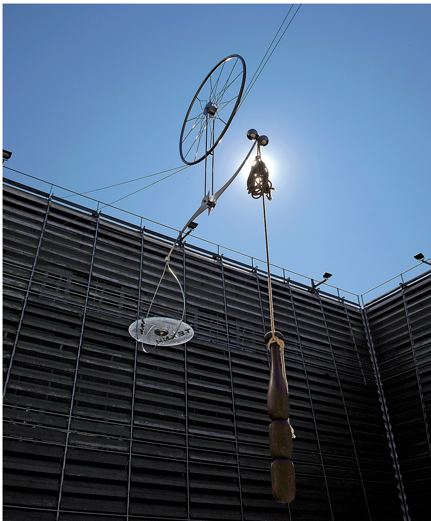
Άποψη της έκθεσης Αφιέρωμα στον γλύπτη Θόδωρο στο κτήριο της οδού Πειραιώς.

τους κύκλους της ζωής και της τέχνης στην αναζήτηση της συνέχειας, στη διαχρονικότητα. Στο τελετουργικό χρησιμοποιήθηκαν βασικά υλικά από τη γενέτειρά του: κρασί, λάδι, όσπρια-καρποί, τους οποίους έσπειρε στον πράσινο τύμβο. Στο πλαίσιο της έκθεσης πραγματοποιήθηκε συζήτηση σε στρογγυλό τραπέζι, καθώς και παρουσίαση της έκδοσης για τον καλλιτέχνη.