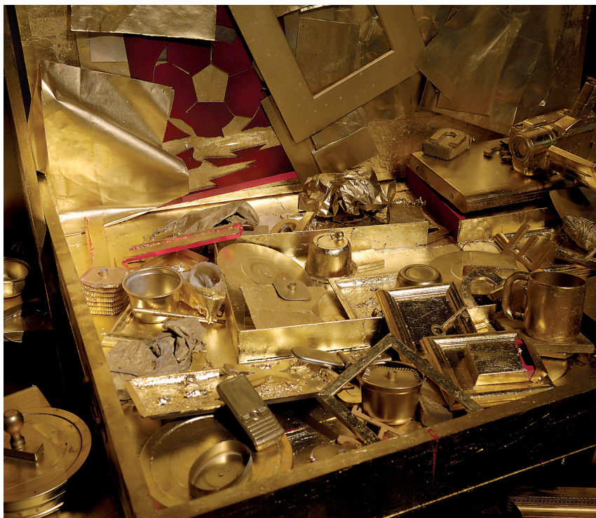
Άποψη της έκθεσης Από τον Picasso στον Koons στο κεντρικό κτήριο.

Τσαρούχης, ο Σπύρος Βασιλείου, ο Γιάννης Σπυρόπουλος, αλλά και αρκετοί νεότεροι, όπως ο Παναγιώτης Τέτσης, ο Αλέκος Λεβίδης, ο Γιώργης Βαρλάμος, ο Δημήτρης Μνταράς και ο Αλέκος Φασιανός. Παράλληλα παρουσιάστηκαν και ορισμένα από τα ημερολόγια, τα οποία, εκτός από ιστορικά πλέον τεκμήρια, αποτελούν και έργα τέχνης.