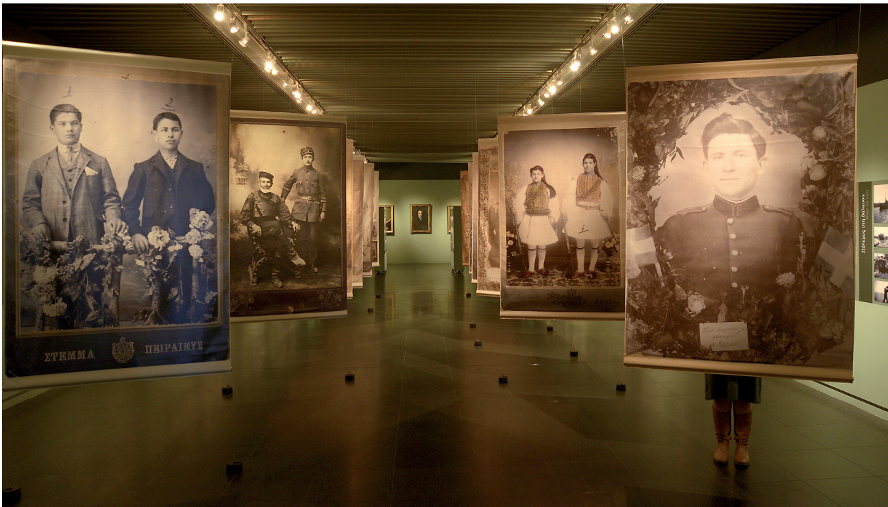
Αποψη της έκθεσης Βαλκανικοί Πόλεμοι 1912-1913 στο κεντρικό κτήριο.

στηκαν μεταξύ άλλων στην έκθεση, έθεσαν εκ νέου το ζήτημα της σύνδεσης της αργυροχοΐας με την καλλιτεχνική δημιουργία. Η έκθεση, η οποία είχε ήδη παρουσιαστεί στη Γαλλία και στις ΗΠΑ, πλαισιώθηκε στην ελληνική διοργάνωση από έργα Ελλήνων δημιουργών που είχαν πειραματιστεί με τη φόρμα του κοσμήματος.