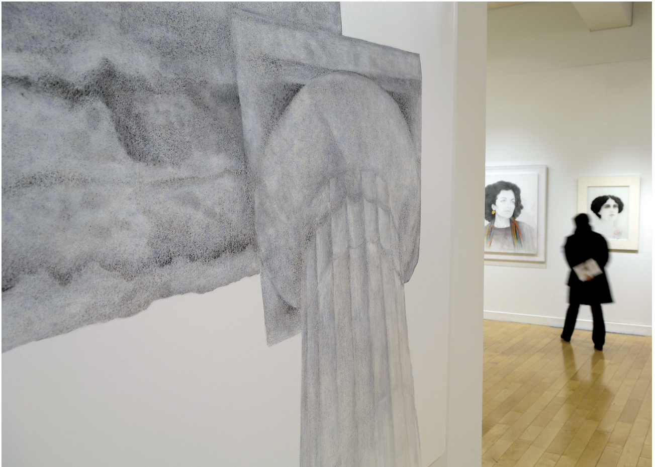
Άποψη της έκθεσης Σόρογκας. 50 χρόνια ζωγραφικής στο κτήριο της οδού Πειραιώς.

και πρότειναν κτήρια - καθεδρικούς ναούς του πλήθους σε μια πόλη σε κρίση, την Αθήνα. Το εργαστήριο των πληθοδομών επέτρεπε στον επισκέπτη να σταθεί, να καθίσει, να δει, να διαβάσει, να χτίσει, συμμετέχοντας ενεργά σε μια ιδέα αρχιτεκτονικής.