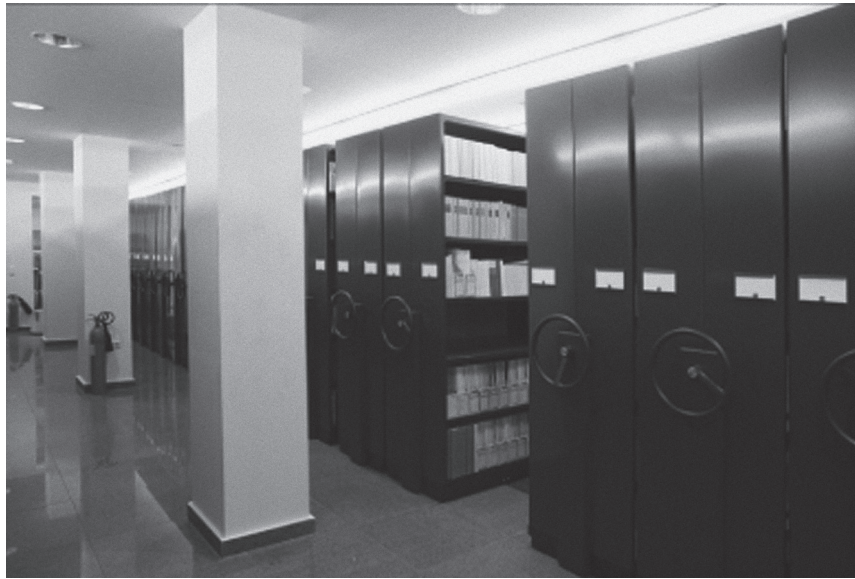
Άποψη του νέου βιβλιοστασίου.