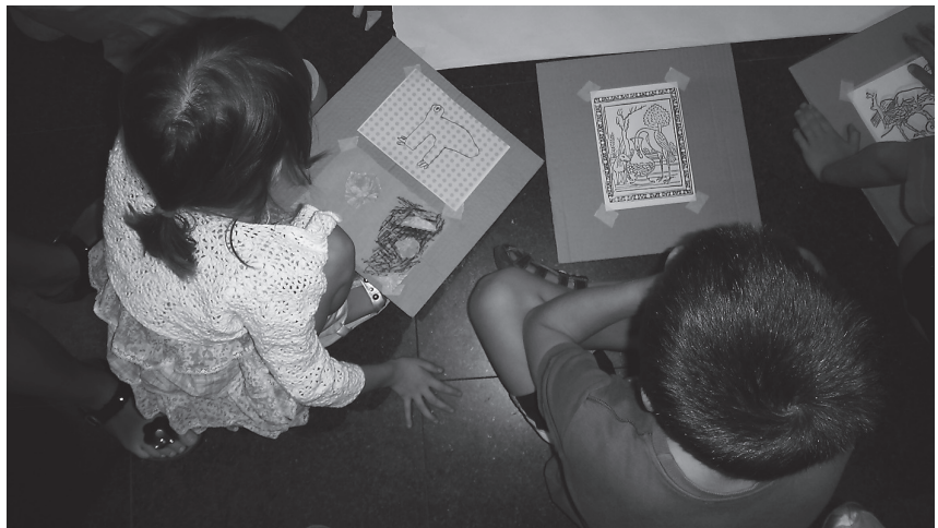
Εικ. 1. Αυτοσχέδια εγκατάσταση εφήβων στο πλαίσιο της έκθεσης Made in Britain .

Οι διαλέξεις με τη μορφή θεματικών κύκλων οργανώθηκαν περαιτέρω