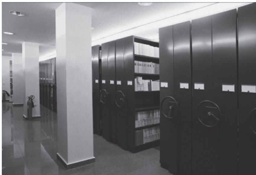
Άποψη του νέου βιβλιοστασίου.