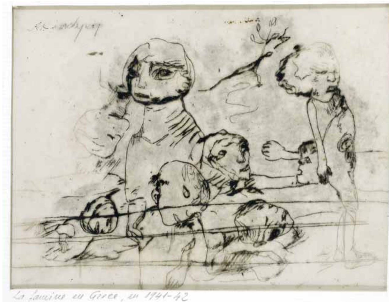
Εικ. 3. Η Ελλάδα το 1941 , μελάνι σε χαρτί, 9 x 12 εκ., χ.χρ. Αθήνα, Μουσείο Μπενάκη, αρ. ευρ. 44412.

καίρι του 1975, λίγο πριν από τον θάνατό του. 13