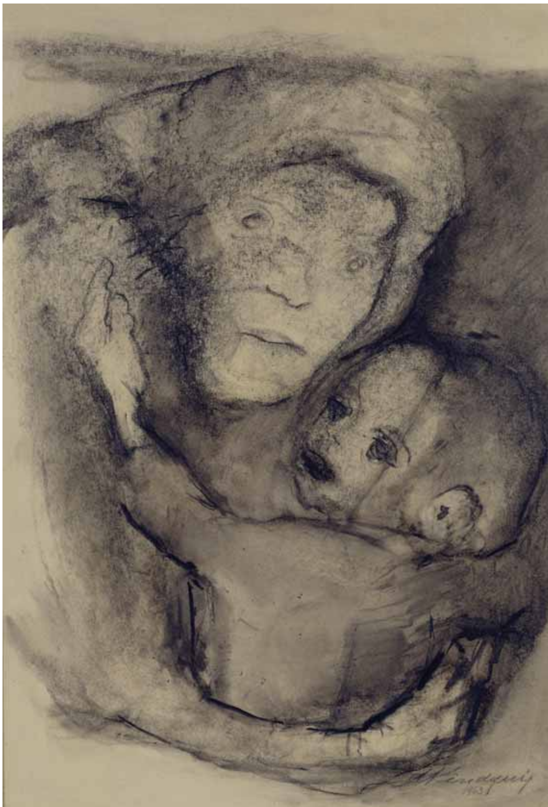
Εικ. 7. Μητρότητα , κάρβουνο σε χαρτόνι, 29,5 x 24 εκ., 1963. Αθήνα, Μουσείο Μπενάκη, αρ. ευρ. 44358.