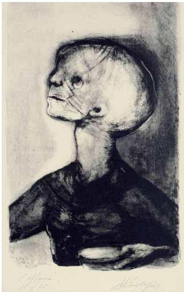
Εικ. 2. Παιδί , χαρακτηριστικό, 31 x 14 εκ., χ.χρ. Αθήνα, Μουσείο Μπενάκη, αρ. ευρ. 44483.

το Κομμουνιστικό Κόμμα μπορούν να χαρακτηριστούν ως χαλαροί και μάλλον τυπικοί. Σε κάθε περίπτωση, ο έλεγχος του φοιτητικού συλλόγου των Ελλήνων πέρασε γρήγορα στην Αριστερά. 8