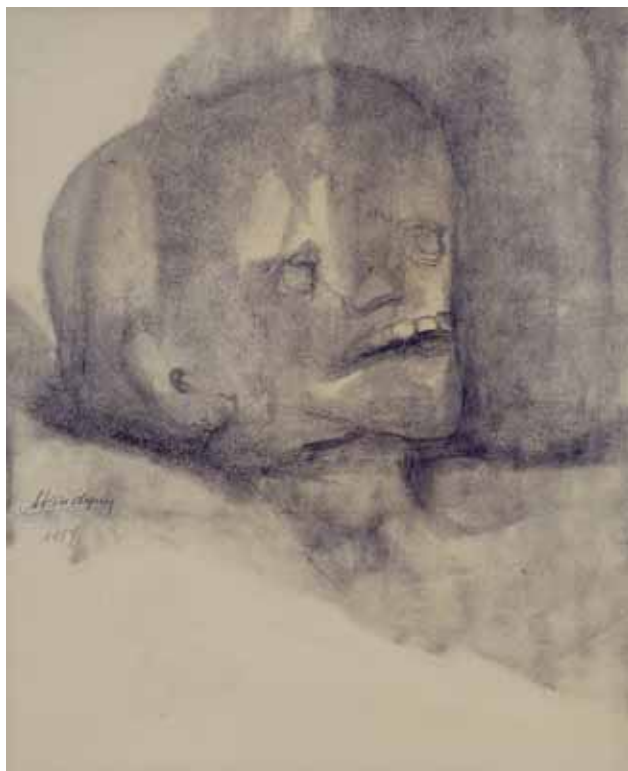
Εικ. 1. Το τέλος , κάρβουνο σε χαρτί, 39 x 33 εκ., 1957. Αθήνα, Μουσείο Μπενάκη, αρ. ευρ. 44369.

ρη φορά στη Μυτιλήνη, πριν εγκατασταθούν οριστικά στην Αθήνα το 1930.