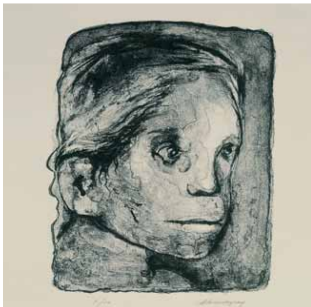
Εικ. 5. Παιδί , χαρακτηριστικό, 32 x 25 εκ., χ.χρ. Αθήνα, Μουσείο Μπενάκη, αρ. ευρ. 44486.