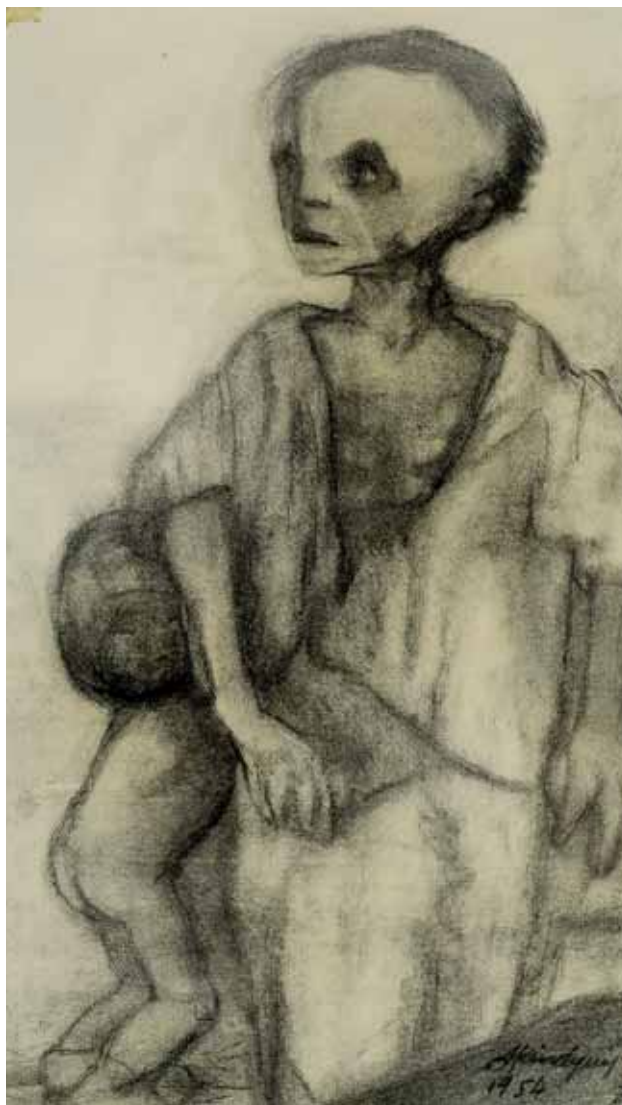
Εικ. 4. Η Πείνα , κάρβουνο σε χαρτί, 40,5 x 23 εκ., 1954. Αθήνα, Μουσείο Μπενάκη, αρ. ευρ. 44384.

Τα έργα της εικοσαετίας αυτής αποτελούν από μόνα τους μια αυτόνομη ενότητα, τη σημαντικότερη στο έργο της Κινδύνη. Αυτό δεν οφείλεται μόνο στην αξιοθαύμαστη ποσότητα, ούτε στη σταθερή ποιότητά τους, αλλά κυρίως στην επιμονή με την οποία παράγονται, χωρίς να μεταβάλλονται ούτε τα θέματα, ούτε τα υλικά. Η συνέπεια αυτή φανερώνει μια πολύ σημαντική εσωτερική αναγκαιότητα, που είναι η κινητήριος δύναμη για την πα-