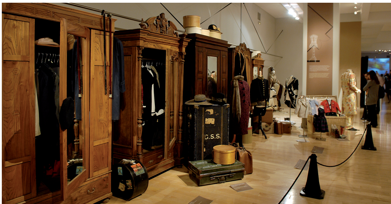
Άποψη της έκθεσης ΕΝΔΥΕΣΘΑΙ. Για ένα Μουσείο Πολιτισμού του Ενδύματος στο κτήριο της οδού Πειραιώς.

κτονικής, πολιτικής και κοινωνίας, και ξεναγήθηκαν μέσω μιας χρονολογικής διαδρομής στα κτήρια και τα έργα υποδομής που περιλαμβάνονταν στην έκθεση. Στην ξεχωριστή ταυτότητα κάθε οικοδομήματος εμφανιζόταν ο αρχιτέκτονας, η κατασκευαστική εταιρεία, καθώς και ο χρόνος και ο προϋπολογισμός που χρειάστηκαν για την κατασκευή του. Η έκθεση φιλοδοξούσε να εξηγήσει τον συσχετισμό της οικοδόμησης του δημοκρατικού και κοινωνικού κράτους με τη δημιουργία δημόσιων και κοινωνικών αγαθών στην πρόσφατη ιστορία της Ισπανίας. Η υγεία, η κατοικία, η παιδεία, οι μεταφορές, ο αθλητισμός, ο πολιτισμός και το περιβάλλον υλοποιήθηκαν σε κτήρια και υποδομές που μεταμόρφωσαν το τοπίο της Ισπανίας και την ποιότητα ζωής των πολιτών της. Η δημοκρατία δεν νομιμοποιείται μόνο από την ψήφο των πολιτών αλλά και από την ικανότητά της να παρέχει δημόσια αγαθά – και ως προς αυτό η αρχιτεκτονική διαδραματίζει ρόλο αναντικατάστατο.