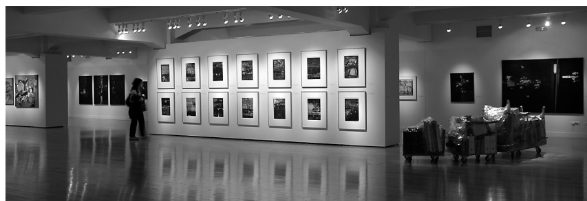
Άποψη της έκθεσης Γιάννης Σπυρόπουλος στο κτήριο της οδού Πειραιώς.

τους πρώτους που έχουν τιμηθεί με το Έπαθλο Σπυρόπουλου, καθώς και ένα ψηφιακό αφιέρωμα με αναφορά στα Έπαθλα Σπυρόπουλου, στις δραστηριότητες και το νέο κτήριο του Μουσείου. Στο πλαίσιο της έκθεσης εκδόθηκε μια συστηματική μονογραφία πάνω στο έργο του κλασικού της Αφαίρεσης Γιάννη Σπυρόπουλου, η οποία βασίζεται στη σχετική διδακτορική διατριβή του Γιάννη Χ. Παπαϊωάννου, ενημερωμένη από τον ίδιο και συνοδευμένη από ένα πλουσιότατο φωτογραφικό υλικό 900 περίπου εικόνων.