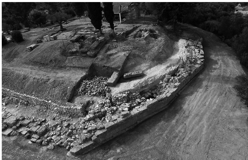
Εικ. 2. Η τεχνητά διαμορφωμένη επιφάνεια στην ανατολική πλευρά του λόφου.

τοίχος αυτός είναι θεμελιωμένος πάνω σε δύο από τα τρία κενά κυκλικά ορύγματα που βρέθηκαν εκεί, μαζί με έναν επίσης κενό κιβωτιόσχημο τάφο. Το ήδη ανεσκαμμένο τμήμα του τοίχου έχει μήκος 20 μ., πλάτος 0,40-0,60 μ. και μέγιστο σωζόμενο ύψος 1,10 μ.