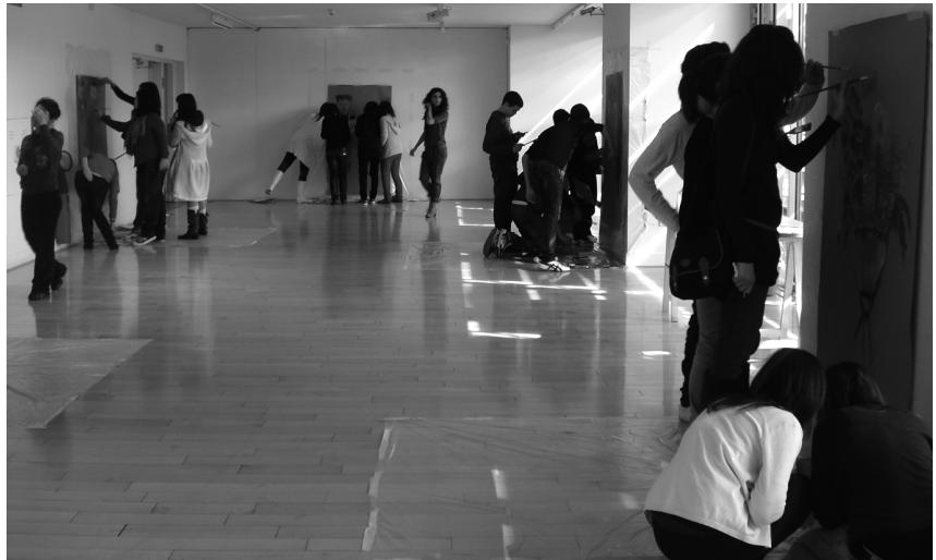
Μαθητές λυκείου σε πρόγραμμα με αφορμή την έκθεση Γιάννης Τσαρούχης 1910-1989 .