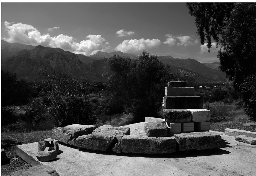
Εικ. 6. Στη δεύτερη εξέδρα συγκεντρώθηκαν και τοποθετήθηκαν δοκιμαστικά ορισμένοι από τους συσχετιζόμενους μεταξύ τους λίθους του κυκλικού βαθμιδωτού Βωμού.