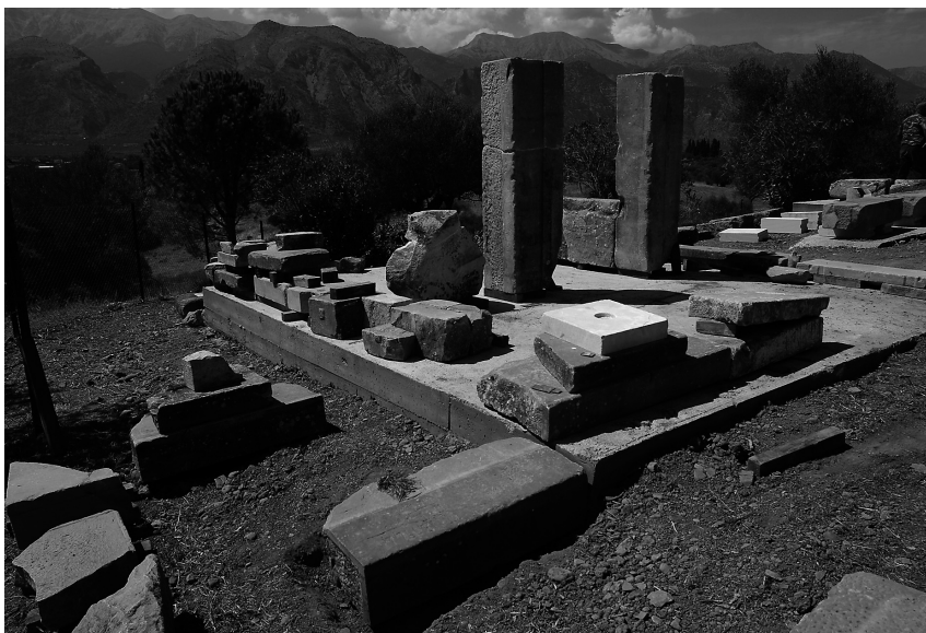
Εικ. 5. Λίθοι από μια είσοδο, από τις βαθμίδες ενός στυλοβάτη με το συνεχόμενο εσωτερικό δάπεδο και από έναν τοίχο με την ευθυνηρία του πάνω σε μία από τις εξέδρες.

—οι αρχιτέκτονες Μαρία Μαγνήσαλη και Θεμιστοκλής Μπιλής συνέχισαν τις δοκιμαστικές τοποθετήσεις αρχιτεκτονικών μελών σε ορισμένα σύνολα από τα δομικά στοιχεία του Θρόνου και του Βωμού, που θα μπορούσαν να χρησιμοποιηθούν κατά την τελική διαμόρφωση του αρχαιολογικού χώρου για την υπαινικτική τους ανάδειξη.