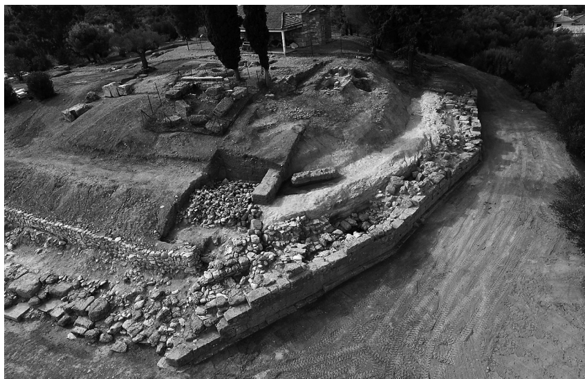
Εικ. 2. Η τεχνητά διαμορφωμένη επιφάνεια στην ανατολική πλευρά του λόφου.

τοίχος αυτός είναι θεμελιωμένος πάνω σε δύο από τα τρία κενά κυκλικά ορύγματα που βρέθηκαν εκεί, μαζί με έναν επίσης κενό κιβωτιόσχημο τάφο. Το ήδη ανεσκαμμένο τμήμα του τοίχου έχει μήκος 20 μ., πλάτος 0,40-0,60 μ. και μέγιστο σωζόμενο ύψος 1,10 μ.