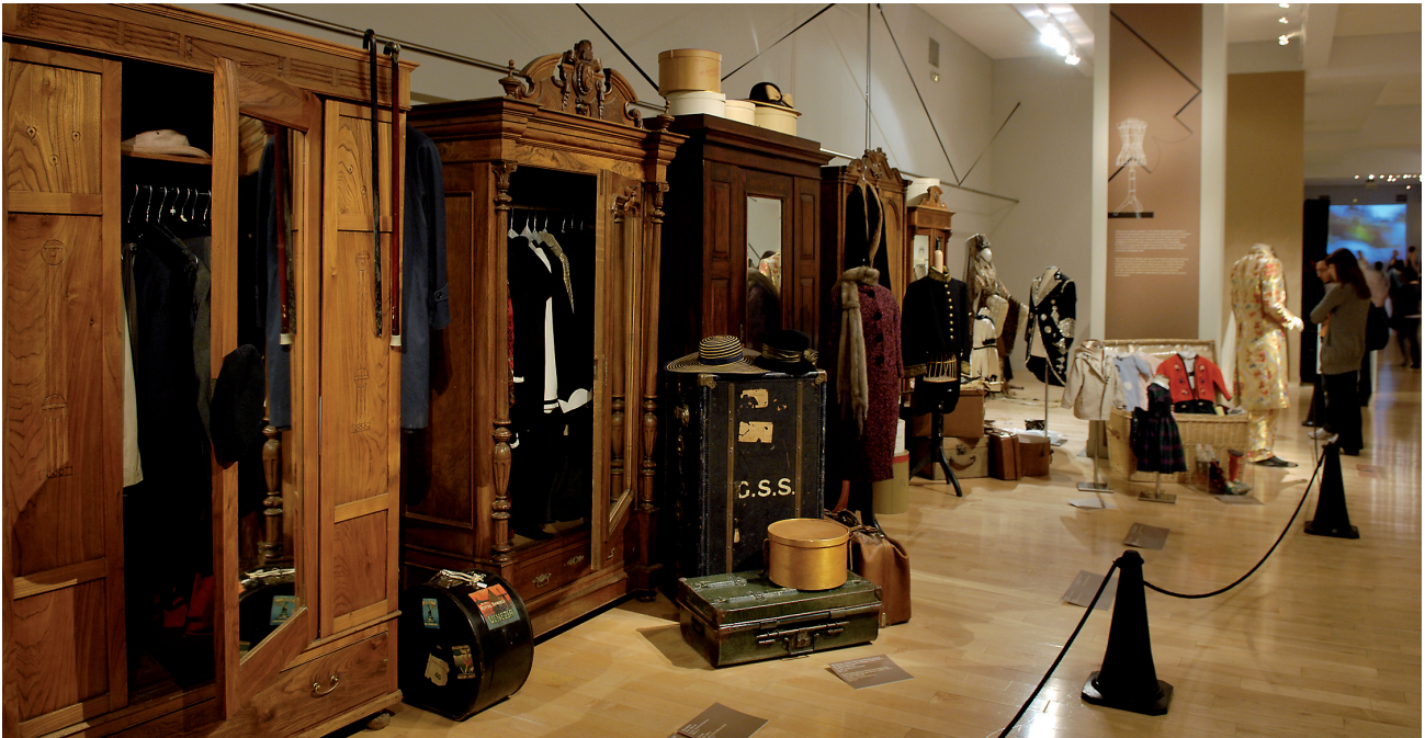
Άποψη της έκθεσης ΕΝΔΥΕΣΘΑΙ. Για ένα Μουσείο Πολιτισμού του Ενδύματος στο κτήριο της οδού Πειραιώς.

κτονικής, πολιτικής και κοινωνίας, και ξεναγήθηκαν μέσω μιας χρονολογικής διαδρομής στα κτήρια και τα έργα υποδομής που περιλαμβάνονταν στην έκθεση. Στην ξεχωριστή ταυτότητα κάθε οικοδομήματος εμφανιζόταν ο αρχιτέκτονας, η κατασκευαστική εταιρεία, καθώς και ο χρόνος και ο προϋπολογισμός που χρειάστηκαν για την κατασκευή του. Η έκθεση φιλοδοξούσε να εξηγήσει τον συσχετισμό της οικοδόμησης του δημοκρατικού και κοινωνικού κράτους με τη δημιουργία δημόσιων και κοινωνικών αγαθών στην πρόσφατη ιστορία της Ισπανίας. Η υγεία, η κατοικία, η παιδεία, οι μεταφορές, ο αθλητισμός, ο πολιτισμός και το περιβάλλον υλοποιήθηκαν σε κτήρια και υποδομές που μεταμόρφωσαν το τοπίο της Ισπανίας και την ποιότητα ζωής των πολιτών της. Η δημοκρατία δεν νομιμοποιείται μόνο από την ψήφο των πολιτών αλλά και από την ικανότητά της να παρέχει δημόσια αγαθά – και ως προς αυτό η αρχιτεκτονική διαδραματίζει ρόλο αναντικατάστατο.