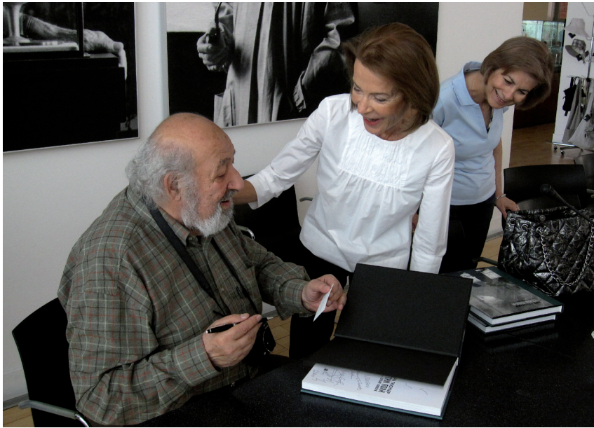
Ο φωτογράφος Ara Güler υπογράφει καταλόγους της έκθεσής του, που διοργανώθηκε στο κτήριο της οδού Πειραιώς.

θέμα την Ισταμπούλ των δεκαετιών 1960 και 1970, επιλεγμένες ειδικά για την έκθεση στο Μουσείο Μπενάκη.