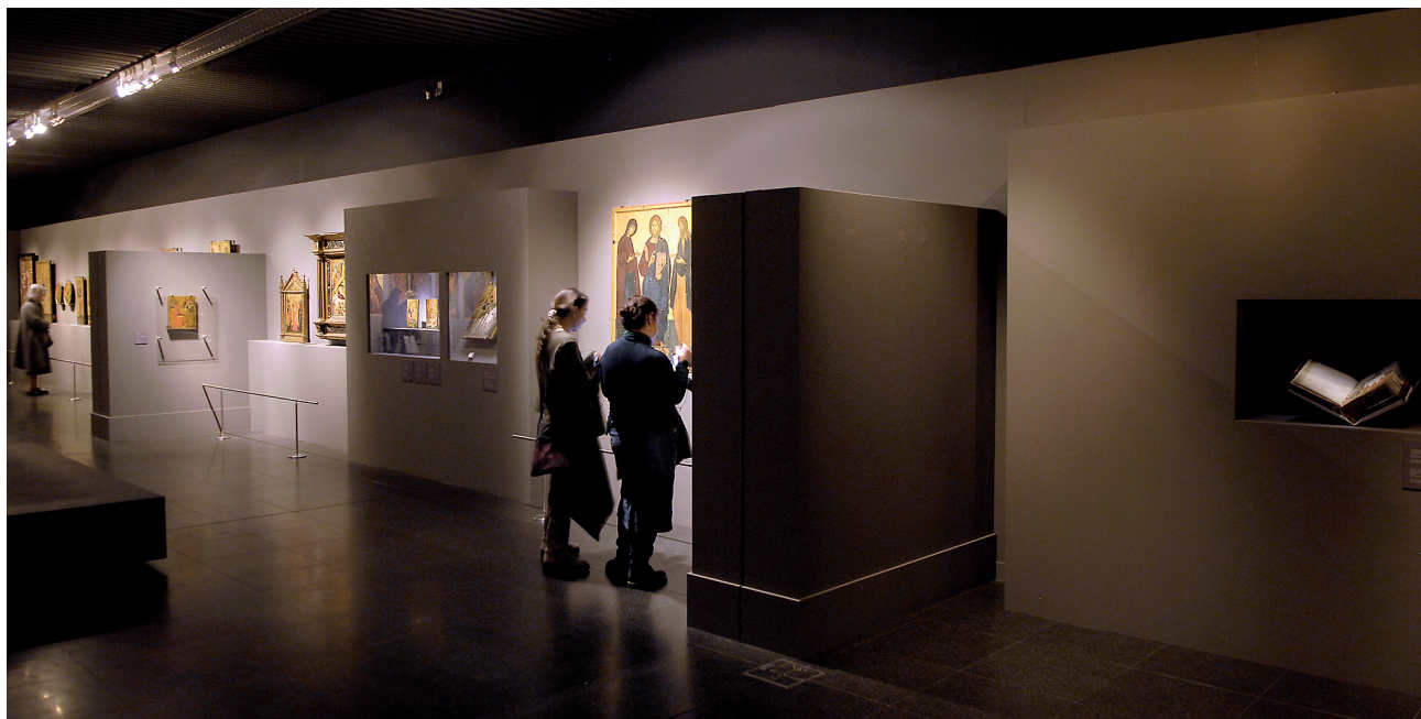
Άποψη της έκθεσης Χειρ Αγγέλου. Ένας ζωγράφος εικόνων στη βενετοκρατούμενη Κρήτη στο κτήριο της οδού Κουμπάρη.