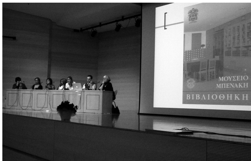
Άποψη από το 3ο Συνέδριο Βιβλιοθηκών Τέχνης που πραγματοποιήθηκε στο κτήριο της οδού Πειραιώς.

και μελετών, την επεξεργασία του υλικού διαφόρων συλλογών. Επιπλέον, περισσότεροι από 300 εξωτερικοί επισκέπτες, αναγνώστες και ερευνητές συμβουλευθήκαν τη συλλογή και εξυπηρετήθηκαν με παραχώρηση φωτοτυπιών και φωτογραφιών. Τον ηλεκτρονικό κατάλογο της συλλογής επισκέφθηκαν πάνω από 10.000 χρήστες μέσω του διαδικτύου, ενώ το wiki της Βιβλιοθήκης επισκέφτηκαν περισσότεροι από 1.629 χρήστες.