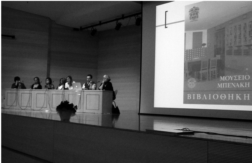
Άποψη από το 3ο Συνέδριο Βιβλιοθηκών Τέχνης που πραγματοποιήθηκε στο κτήριο της οδού Πειραιώς.

και μελετών, την επεξεργασία του υλικού διαφόρων συλλογών. Επιπλέον, περισσότεροι από 300 εξωτερικοί επισκέπτες, αναγνώστες και ερευνητές συμβουλευθήκαν τη συλλογή και εξυπηρετήθηκαν με παραχώρηση φωτοτυπιών και φωτογραφιών. Τον ηλεκτρονικό κατάλογο της συλλογής επισκέφθηκαν πάνω από 10.000 χρήστες μέσω του διαδικτύου, ενώ το wiki της Βιβλιοθήκης επισκέφτηκαν περισσότεροι από 1.629 χρήστες.