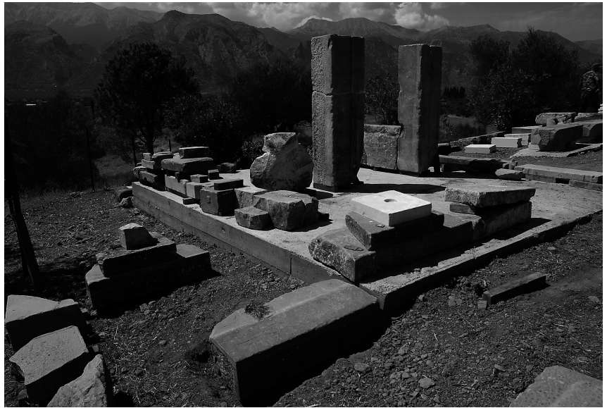
Εικ. 5. Λίθοι από μια είσοδο, από τις βαθμίδες ενός στυλοβάτη με το συνεχόμενο εσωτερικό δάπεδο και από έναν τοίχο με την ευθυνηρία του πάνω σε μία από τις εξέδρες.

—οι αρχιτέκτονες Μαρία Μαγνήσαλη και Θεμιστοκλής Μπιλής συνέχισαν τις δοκιμαστικές τοποθετήσεις αρχιτεκτονικών μελών σε ορισμένα σύνολα από τα δομικά στοιχεία του Θρόνου και του Βωμού, που θα μπορούσαν να χρησιμοποιηθούν κατά την τελική διαμόρφωση του αρχαιολογικού χώρου για την υπαινικτική τους ανάδειξη.