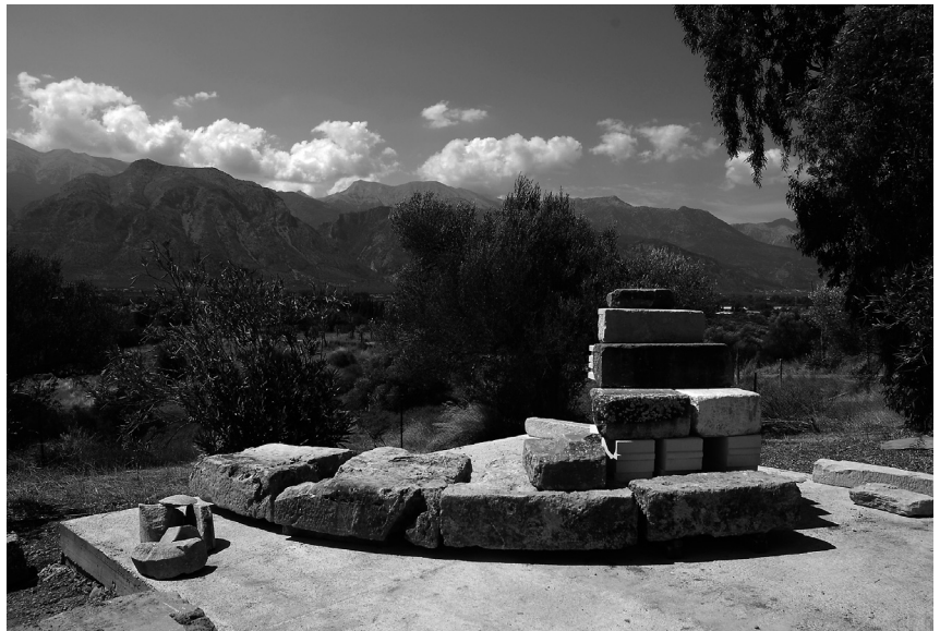
Εικ. 6. Στη δεύτερη εξέδρα συγκεντρώθηκαν και τοποθετήθηκαν δοκιμαστικά ορισμένοι από τους συσχετιζόμενους μεταξύ τους λίθους του κυκλικού βαθμιδωτού Βωμού.