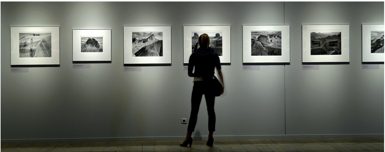
Άποψη της έκθεσης ANSEL ADAMS στο κτήριο της οδού Πειραιώς.

Αγγέλου. Ένας ζωγράφος εικόνων στη Βενετοκρατούμενη Κρήτη (εκδ. Μουσείο Μπενάκη, Αθήνα 2010, έκδοση: ελληνική, ISBN 978-960-476-070-1).