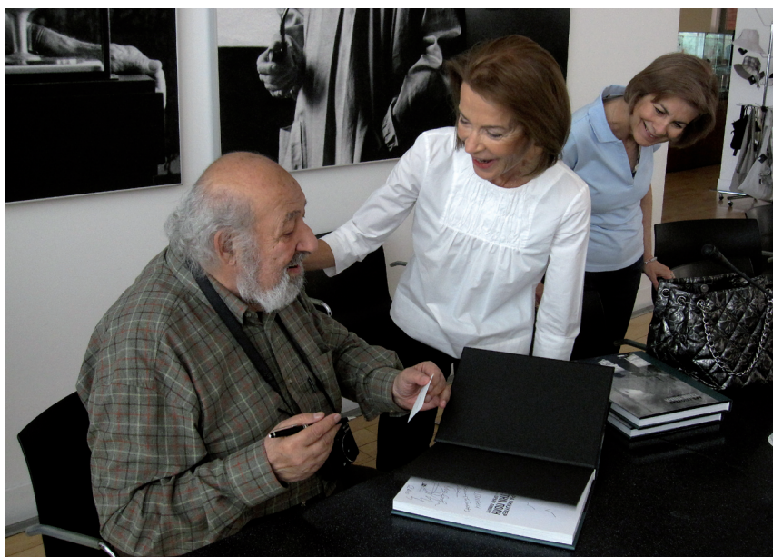
Ο φωτογράφος Ara Güler υπογράφει καταλόγους της έκθεσής του, που διοργανώθηκε στο κτήριο της οδού Πειραιώς (φωτ.: Λ. Κουργιαντάκης).

θέμα την Ισταμπούλ των δεκαετιών 1960 και 1970, επιλεγμένες ειδικά για την έκθεση στο Μουσείο Μπενάκη.