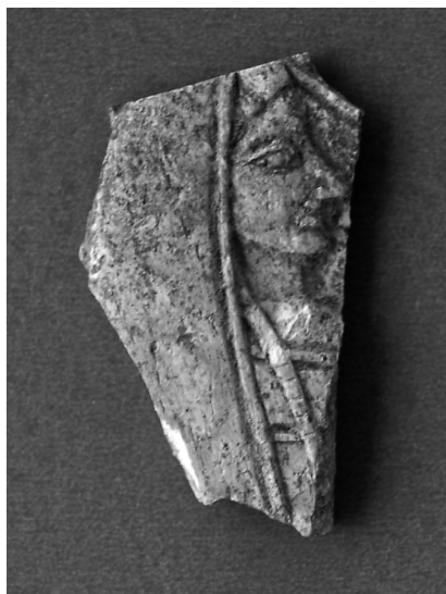
Εικ. 1. Ελεφαντοστέινο πλακίδιο με παράσταση γυναικείας μορφής, αρχαϊκών χρόνων.