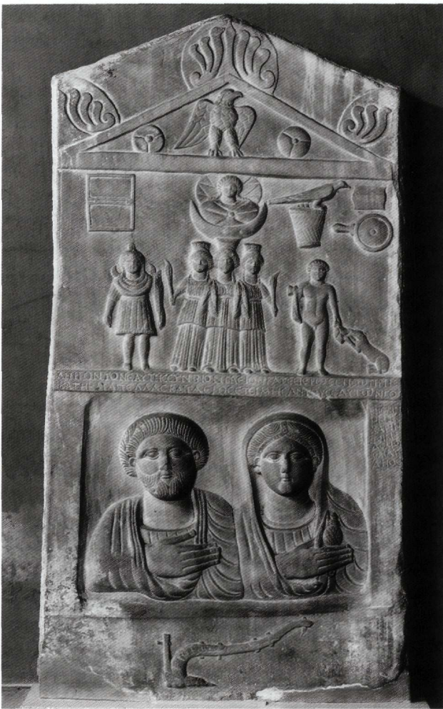
Abb. 4. Phrygische Grabstele. Istanbul, Archäologisches Museum.

im 2. Jh. n. Chr. verdrängt zu haben. 22