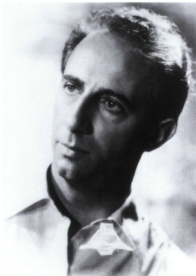
Εικ. 1. Ο συνθέτης Γιάννης Α. Παπαϊωάννου σε φωτογραφία του 1955.

τεχνικές και τις προσεγγίσεις που ακολουθεί κάθε φορά. Ξεκινώντας από τις “ιμπρεσιονιστικές” τάσεις και τη χρήση στοιχείων παραδοσιακής και βυζαντινής μουσικής, μεταπηδά μετά τα πρώτα χρόνια της δεκαετίας του '50 σε νεότερες τεχνικές, όπως η δωδεκάφθογγη, η σειραϊκή και η μετασειραϊκή, για να καταλήξει μετά το 1966 σε ένα εντελώς προσωπικό μουσικό συντακτικό –πάντα ατονικό–, το οποίο και ακολουθεί μέχρι το τέλος. Τα περισσότερα από τα έργα του έχουν επανειλημμένα εκτελεστεί στην Ελλάδα και στο εξωτερικό, ενώ τα τελευταία χρόνια γίνεται συστηματική προσπάθεια να ηχογραφηθούν και να εκδοθούν. Στην παρούσα μελέτη θα εξεταστεί η Πρώτη Συμφωνία του.