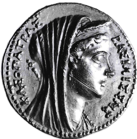
Εικ. 5. Εμπροσθότυπος νομίσματος της Κλεοπάτρας Α΄. Λονδίνο, Βρετανικό Μουσείο CM 1978-10-21-1.

εισάγεται από την Ανατολική Μεσόγειο και το κόστος κατασκευής ενός μαρμάρινου έργου να είναι συγκριτικά υψηλό. 6