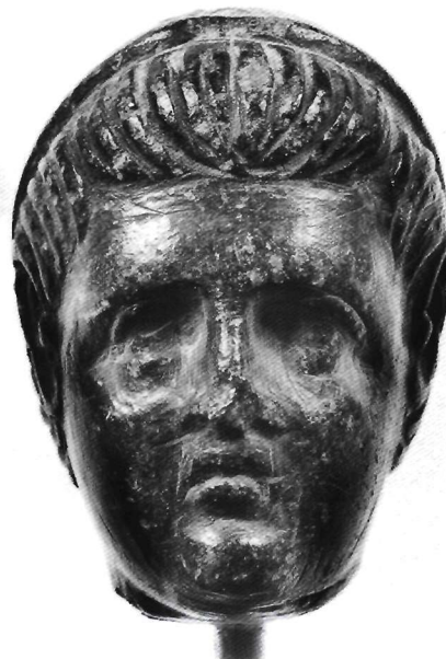
Εικ. 11. Εικονιστική κεφαλή του Πτολεμαίου Θ' ή του Πτολεμαίου Ι'. Αθήνα, Μουσείο Μπενάκη 22588.