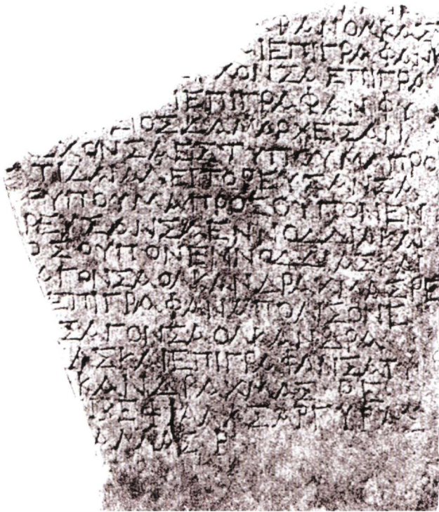
Εικ. 3. Τμήμα μαρμάρινης στήλης με κατάλογο αναθημάτων από το μεγάλο ιερό των Φερών. Το όνομα της θεάς αναφέρεται στους στίχους 9 και 10 (φωτ.: B. Helly).

αποδεικνύεται από τις 11 γνωστές προσωονυμίες της. Στις πρωταρχικές λειτουργίες της η Εννοδία ήταν μια φοβερή θεά του θανάτου και των δρόμων. Αν και βασικά παραμένει μια θεά του Κάτω Κόσμου, του θανάτου, των δρόμων, ήδη από τα μέσα του 5ου αι. π.Χ. μεταμορφώνεται ποιοτικά σε επίσημη και λαϊκή θεά των θεσσαλικών πόλεων, οι δυνάμεις της οποίας κάλυπταν μεγάλο φάσμα των ανθρώπινων αναγκών. Η πανάρχαια τοπική δέσποινα γίνεται πατροπαράδοτη, και η λατρεία της διαδίδεται εκτός Φερών και Θεσσαλίας πριν από τα κλασικά χρόνια, αφού είναι γνωστή στη Λάρισα και στην Αθήνα πριν από τα μέσα του 5ου αι. π.Χ.