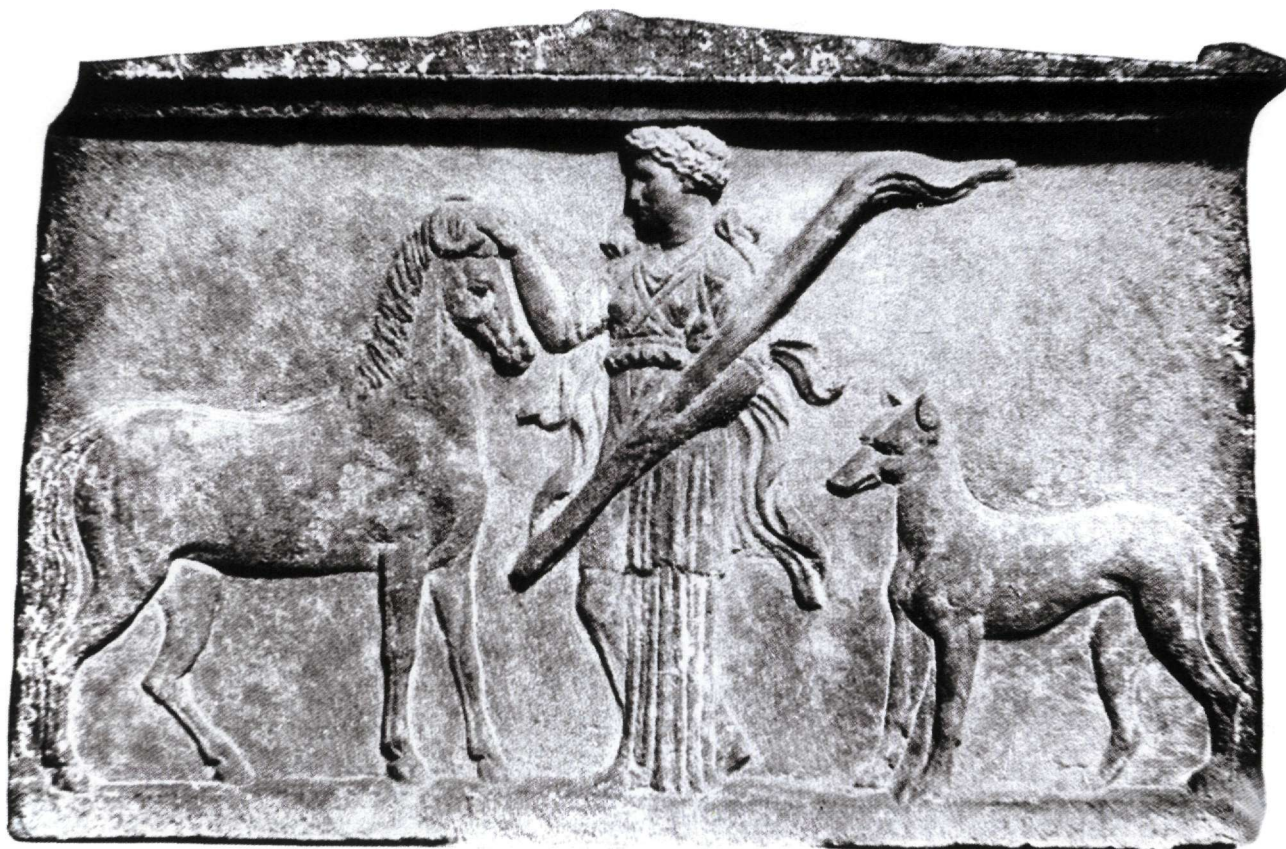
Εικ. 5. Μαρμάρινο αναθηματικό ανάγλυφο από την Κραννώνα με τη φωσφόρο Εννοδία.

ενδοχώρα με τα λιμάνια του Παγασητικού κόλπου. Η πόλη, χάρη στη σπουδαία θέση της και κατέχοντας τα περάσματα, έλεγχε τις επικοινωνίες, τις μεταφορές και το εμπόριο –απολαμβάνοντας σημαντικά έσοδα και πολιτική δύναμη. Για την ευνοημένη από τη φύση θέση και τα πλεονεκτήματα που απέρρεαν από αυτήν, οι Φεραίοι θεώρησαν υπεύθυνη και φυσική ευεργέτιδά τους τη θεά των δρόμων, την Εννοδία, την οποία λάτρευσαν ιδιαίτερα. Πρόκειται για λατρευτικό επίθετο, που στη συνέχεια μεταβλήθηκε σε κύριο όνομα.