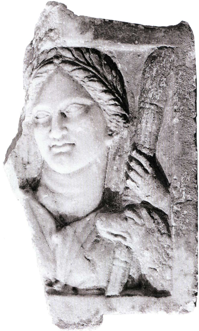
Εικ. 4. Μαρμάρινη ανάγλυφη στήλη της φωσφόρου Εννοδίας με σκυλί από τη Λάρισα.

Από την έρευνα έχει υποστηριχτεί ότι η θεά λατρευόταν στις Φερές πριν από την άφιξη των Θεσσαλών στα τέλη του 12ου αι. π.Χ. και επομένως καταγόταν από μία αιολική « πότνια ». 34 Ότι δηλαδή η θεά λατρευόταν από τους Αιολείς πριν από την άφιξη των Θεσσαλών, που τοποθετείται 60 χρόνια μετά την άλωση της Τροίας (Ηρόδοτος, VII, 176· Θουκυδίδης, I, 12). Αυτή η άποψη είναι πολύ πιθανή: α) αν αναλογιστούμε την ισχυρή τοπική λατρεία της, η οποία πιστοποιείται από τα αρχαιολογικά ευρήματα της μυκηναϊκής εποχής, που βρέθηκαν στο μεγάλο ιερό της· β) γιατί οι σχετικοί μύθοι που αναφέρονται στη θεά, αλλά και ο μύθος της Άλκηστης, ανάγονται στα μυκηναϊκά χρόνια· γ) γιατί στα χρόνια του ιωνικού αποικισμού η Εννοδία αναφέρεται ως η εθνική θεά των Θεσσαλών (Πολύαινος, Στρατηγήματα , VIII, 43). Η τοπική αυτή θεότητα αγνοείται τόσο από τον Όμηρο, όσο και από τον Ησίοδο, ο οποίος όμως παρουσιάζει με θρησκευτικό ζήλο την Εκάτη 35 ( Θεογονία , 411-52), θεά συγγενική και παράλληλη με την Εννοδία. Μπορεί να υποστηριχτεί, ότι κατά τα μυκηναϊκά χρόνια στον αρχικό πυρήνα της λατρείας της θεάς βρισκόταν η Άλκηστη, τοπική βασίλισσα του Κάτω Κόσμου και πάρεδρος του Άδητου, του κυρίαρχου του Άδη και των νεκρών. Η αναφορά του Ευριπίδη ( Άλκυστη , 835-36, 995-1005) θα μπορούσε να θεωρηθεί καίρια για τη φύση και τη γένεση της