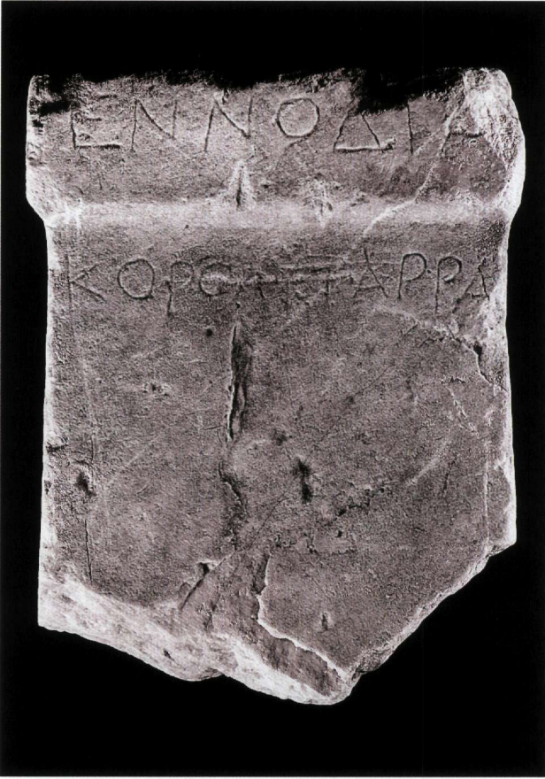
Εικ. 1. Η αναθηματική στήλη στην Εννοδία Κορουτάρρα. Αθήνα, Μουσείο Μπενάκη 30705.

γραμμάτων της με άλλες θεσσαλικές αναθηματικές επιγραφές, όπως για παράδειγμα με αυτήν στην Εννοδία Πατρῶα από τις Παγασές (εικ. 2). 6