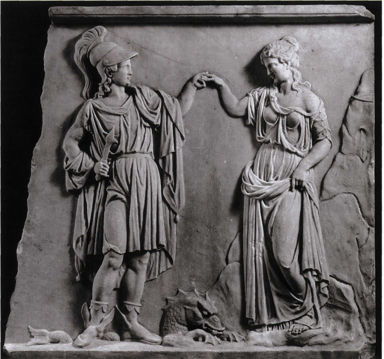
Εικ. 1. Περσέας και Ανδρομέδα , μάρμαρο, 61,5 x 65 x 7 εκ. Αθήνα, Μουσείο Μπενάκη 31163.

η οποία και δέθηκε σε παράκτιο βράχο –στο ανάγλυφο μας ο βράχος μόλις που διακρίνεται στην άκρη πίσω από την Ανδρομέδα. Ο Περσέας απλώνει το αριστερό του χέρι προκειμένου να πιάσει το δεξί της κοπέλας· ζητά να την κάνει γυναίκα του. Η μορφή του ήρωα είναι μετωπική, σε ελαφριά στροφή προς το μέρος της Ανδρομέδας, προς την οποία έχει στρέψει και το κεφάλι του. Φορά ακόμα την περικεφαλαία του Πλούτωνα, που τον έκανε αόρατο, και τα φτερωτά πέ-