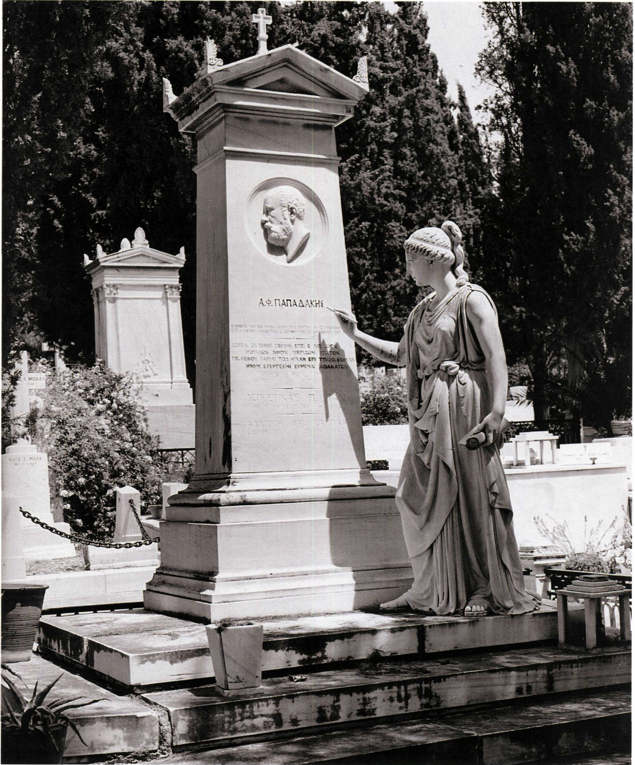
Εικ. 4. Γεωργίου Βρούτου, Προσωποποίηση της Επιστήμης , 1881, μάρμαρο, τάφος Αντώνιου Φ. Παπαδάκη, Α' Νεκροταφείο της Αθήνας (φωτ.: Στ. Λυδάκης, Η νεοελληνική γλυπτική. Ιστορία – Τυπολογία – Λεξικό γλυπτών , Αθήνα 1981 [= Οι Έλληνες γλύπτες , 5]).