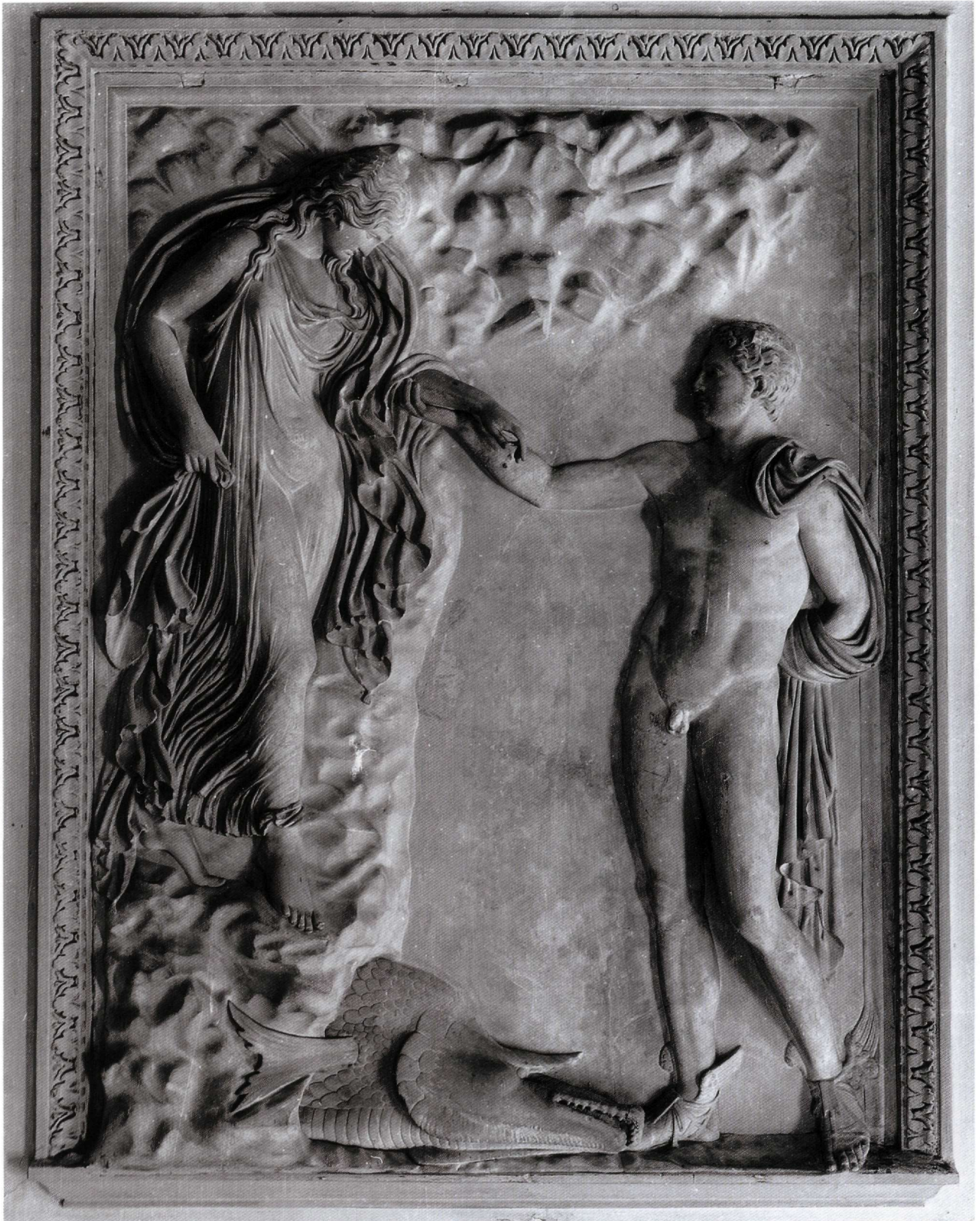
Εικ. 5. Περσέας και Ανδρομέδα , μάρμαρο, 155 x 109 εκ., μέσα του 2ου αι. μ.Χ. Ρώμη, Μουσεία Καπιτωλίου.