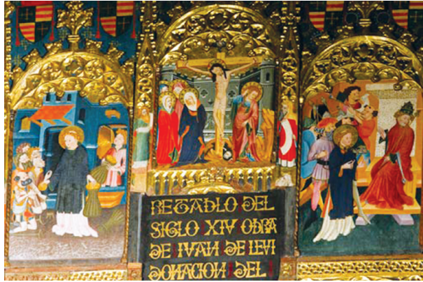
Πέτασμα βομού, έργο των αδελφών Λεβή, λεπτομέρεια, c. 1400, Καθεδρικός ναός, Tarazona, Ισπανία.

Ας προστεθεί εδώ ότι και στο ορθόδοξο περιβάλλον, συγκεκριμένα στην Κρήτη, στις αρχές του 16ου αιώνα, εντοπίζουμε εβραίους ζωγράφους ορθόδοξων χριστιανικών εικόνων, όπως για παράδειγμα τον Avadinka, εβραίο και κάτοικο της εβραϊκής συνοικίας του Χάνδακα (1532) 4 .