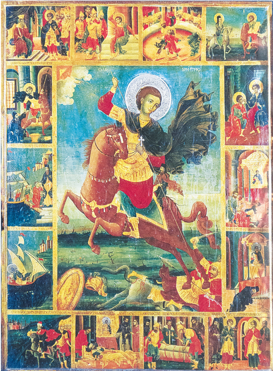
Εικ. 2: Φορητή εικόνα, 1800, Ι. Μονή Φιλοθέου Αγίου Όρους.