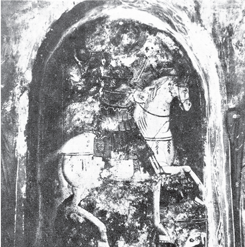
Εικ. 1: Τοιχογραφία, 1323, Άγιος Γεώργιος Ανυδριώτης, Κρήτη, Λασιθιωτάκης, Άγιος Γεώργιος, πίν 29, εικ. 1 (άδεια φωτ.: Ε.Κ.Ι.Μ. & Οικογένεια Α.Γ. Καλοκαιρινού).