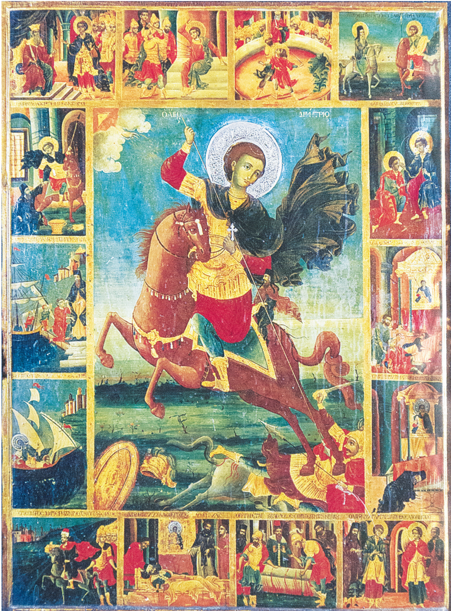
Εικ. 2: Φορητή εικόνα, 1800, Ι. Μονή Φιλοθέου Αγίου Όρους.