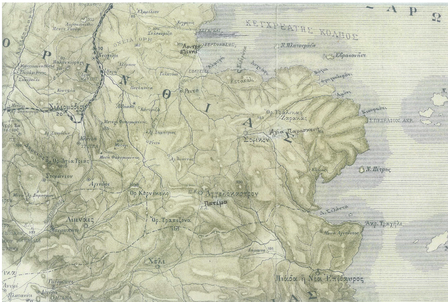
Εικ. 2. Περιοχή Αγγελοκάστρου-Σοφικού (τ. δήμος Σολυγείας) Α. ΜΗΛΙΑΡΑΚΗΣ, Γεωγραφία , εκτός κειμένου (με μικρές μεταβολές).