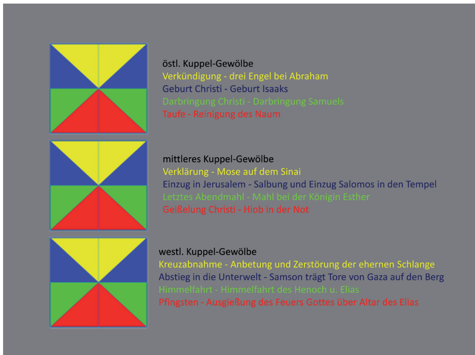
Abb.1: Köln, Maria Lyskirchen, Kuppel-Gewölbe; Schema des Bild-Programmes.