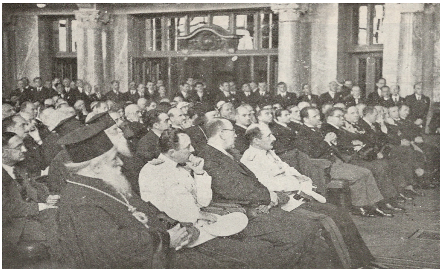
Phot. 2. L'ouverture du IVe Congrès (Sofia, 1934); au premier plan, de gauche à droite, Mgr. Néophyte, Président du Saint-Synode; le Prince Cyrille; K. Guéorguiev, Président du Conseil; le Roi Boris III.