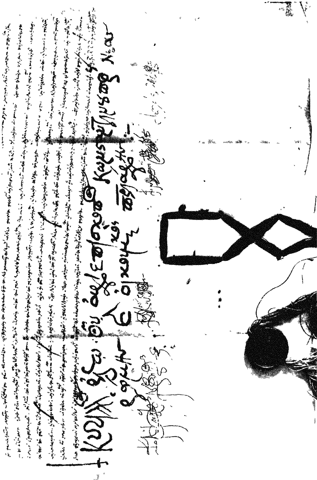
Συνοδικὸν σιγγλιῶδες ἐπιβιβαιωτικὸν γράμμα τοῦ πατριάρχου Κυρίλλου.— Μάρτιος 1630 (κατάλ. ἀρ. 11: ἄνω μέρος)