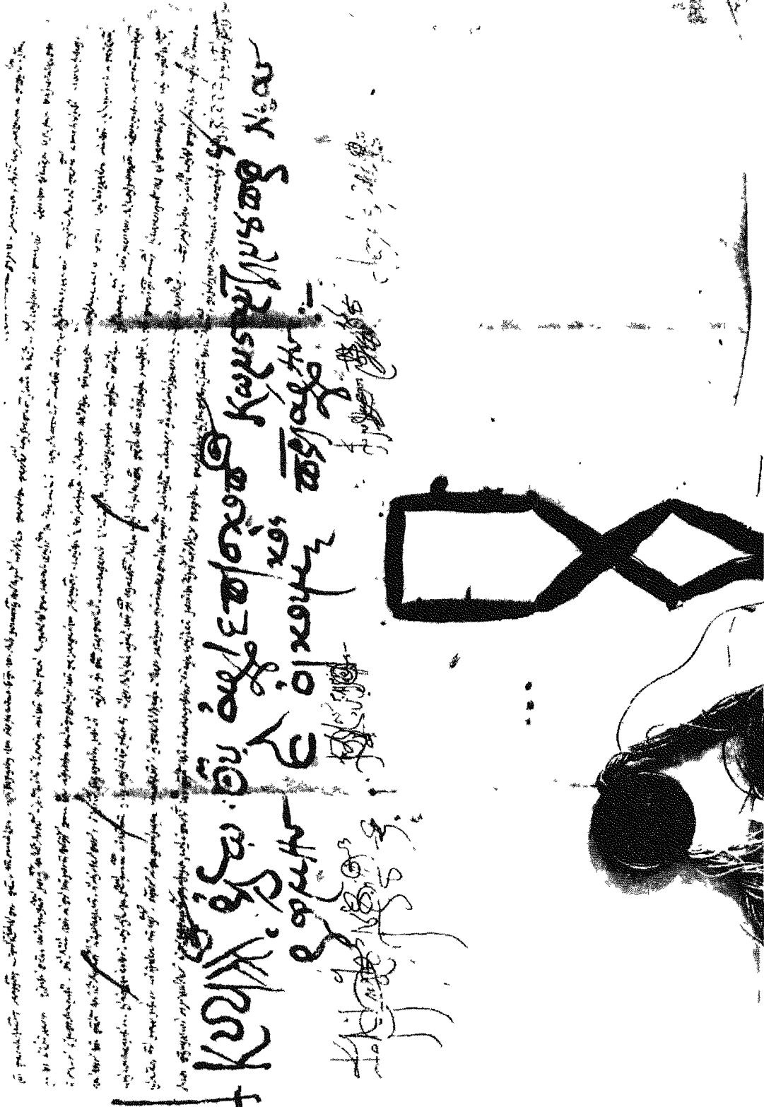
Συνοδικόν σιγγιλιῶδες ἐπιβεβαιωτικόν γράμμα τοῦ πατριάρχου Κυρίλλου.— Μάρτιος 1680