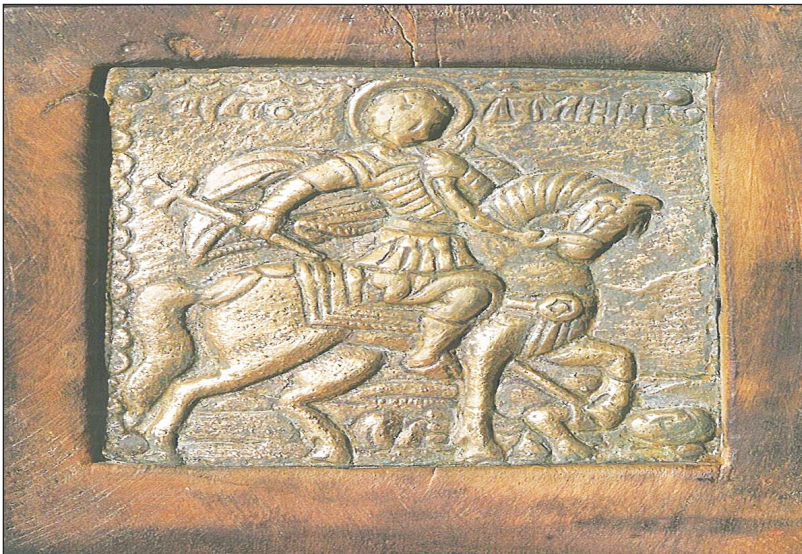
Εικ. 1: Μεταλλικό επάργυρο ανάγλυφο (7,9 X 8,6 εκ.), 15ος αι., Ι. Μ. Αγ. Διονυσίου Αγίου Όρους.