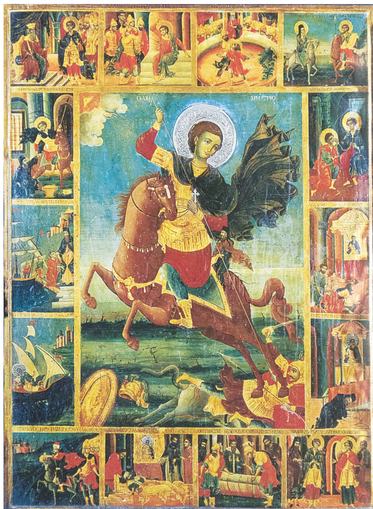
Εικ. 2: Φορητή εικόνα, 1800, Ι. Μονή Φιλοθέου Αγίου Όρους.