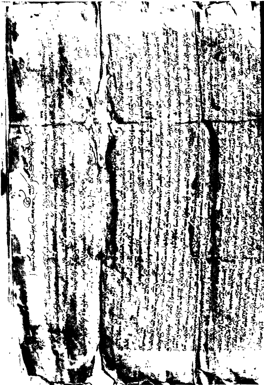
Γράμμα τοῦ πατριάρχου Γερεμίου τοῦ Β'. — Ἀπρίλιος 1579 (κατλ. ἀρ. 5 : ἄνω μέρος).