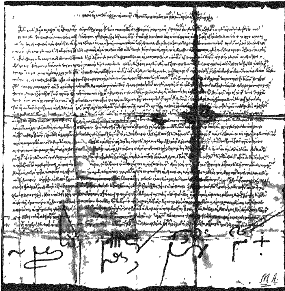
Γράμμα του πατριάρχου Ἱερεμίου του Α' (Ἰανουάριος 1530: Καταλ. ἀρ. 45).