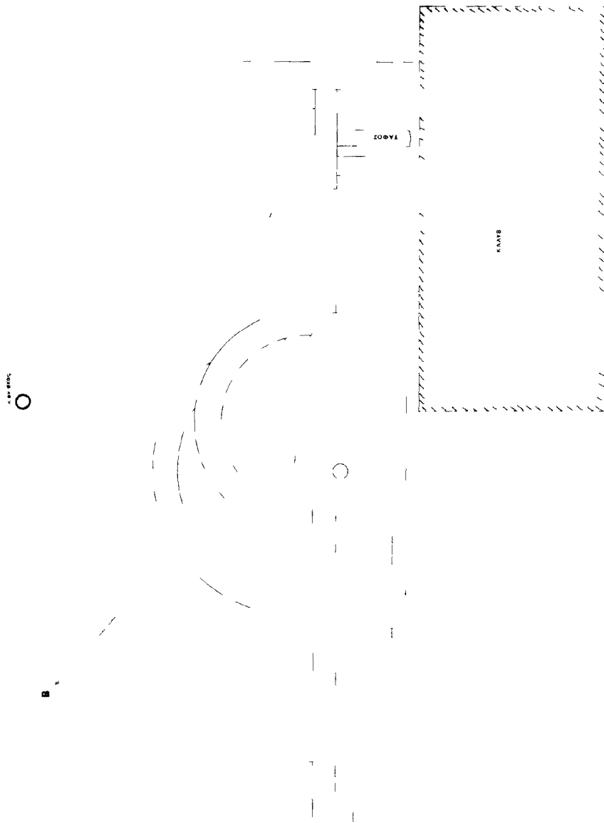
Αποστολοπούλος Χαράλαμπος Χάρτης Αρκαδίας κλίμακας 1:50