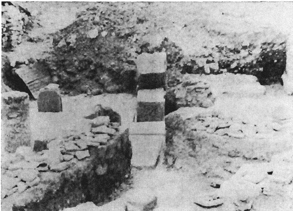
Χωτούσα. Ύρειπια παλαιοχριστιανικῆς βασιλικῆς.