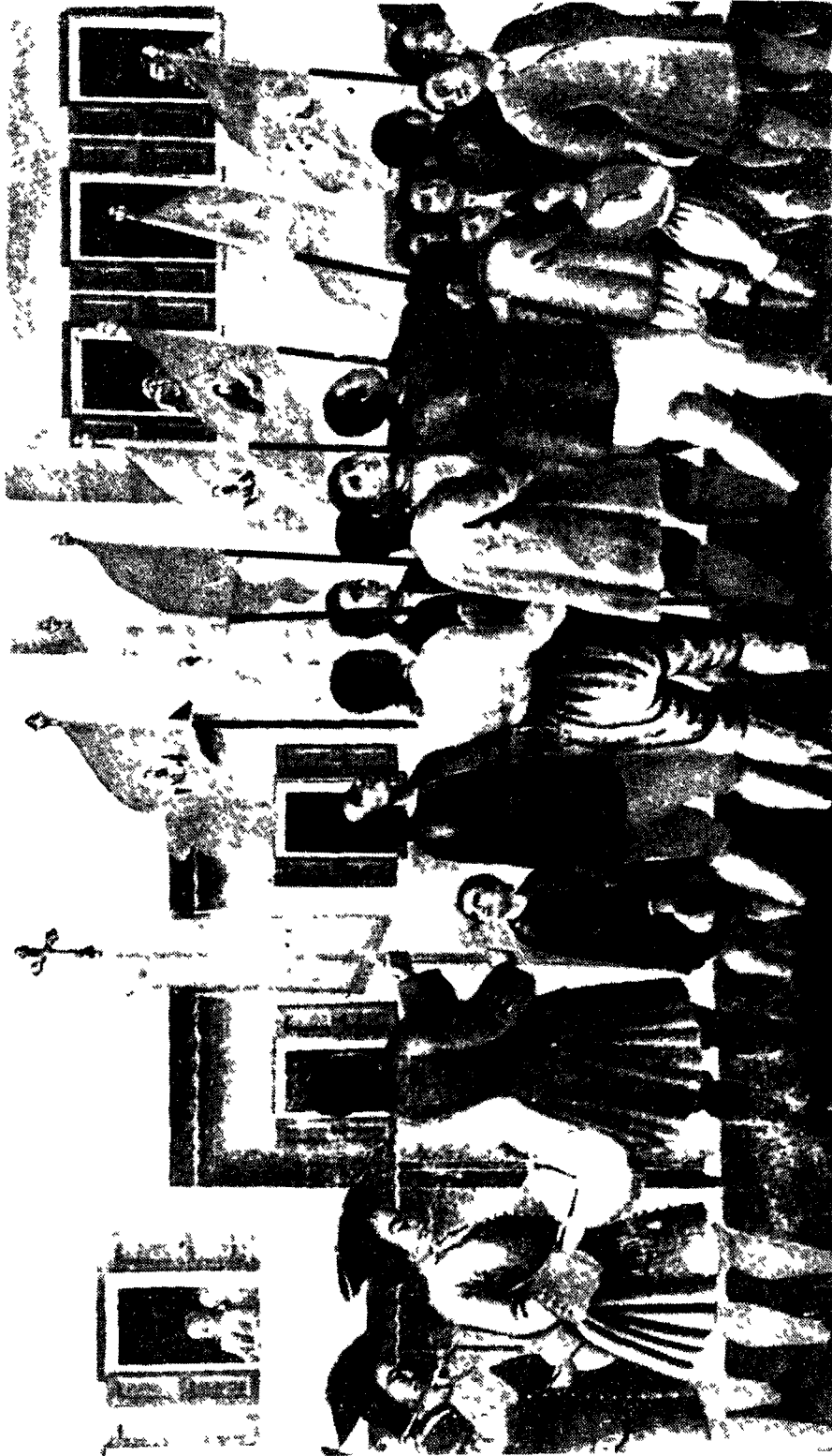
Ιωάννη Κοσμά, Αιτανεία των Αγίων Χαράλαμψη (1756) Δεπ-ουισσιζ Νοισεο Ζζζ, 29θο