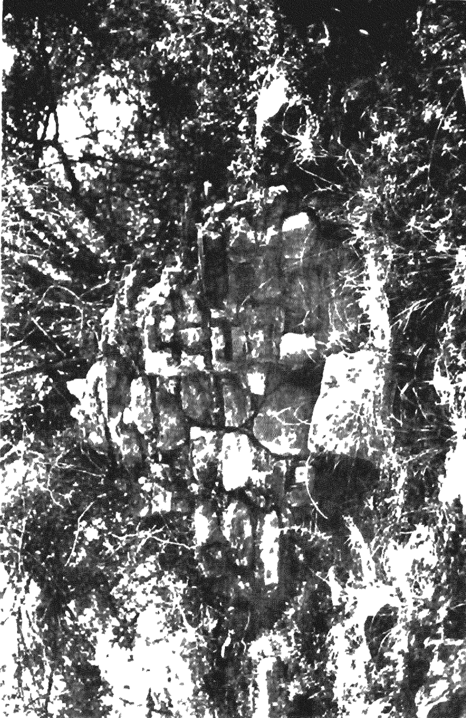
Εικ. 4 Έρευνα του νεοϋασοβυζαντινής εποχής στη θέση Κασσογιγώνα Διαμόρφωση της αλυσίδας