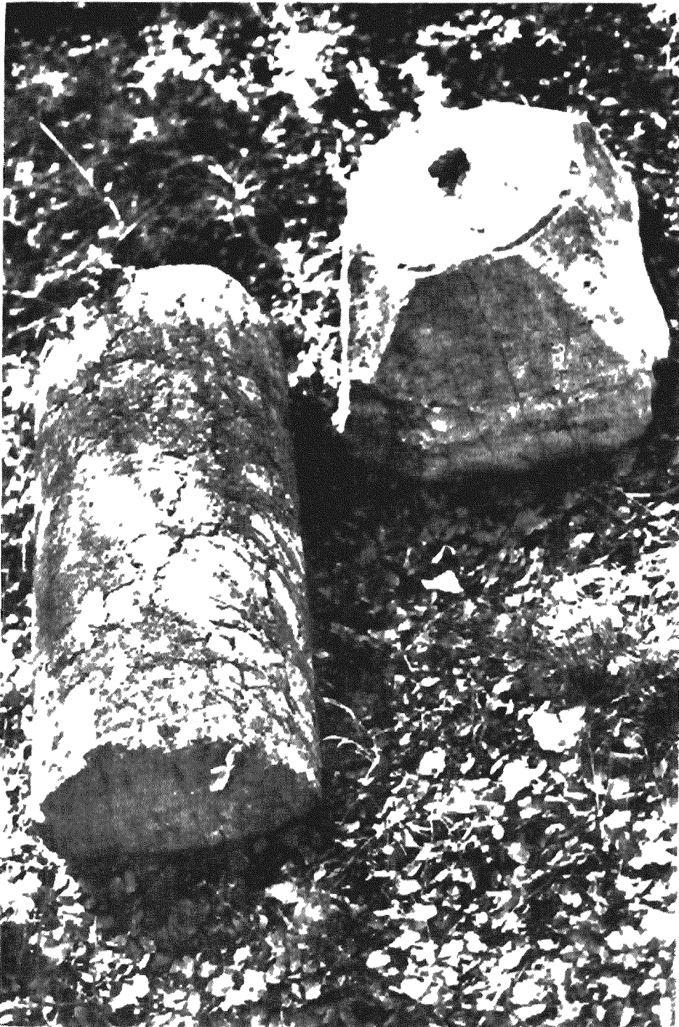
Είκ. 5. Κίονας με τὸ ἐπιθῆμά του ἀπὸ τῆ θέση Καστρούγκαινα