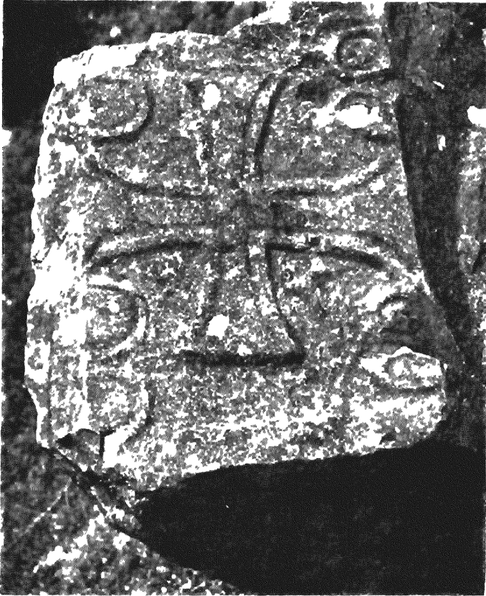
Εικόνα 3 'Επιθήματα με άνάγκυφο ισοσκελή σταυρό στη θέση Σαρκοῦλι Παύλιτσας.