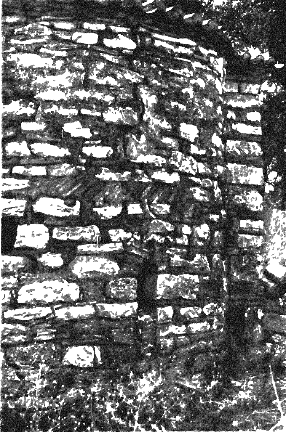
Εικ. 2 'Ανατολική πλευρά του ναού της Παναγίας