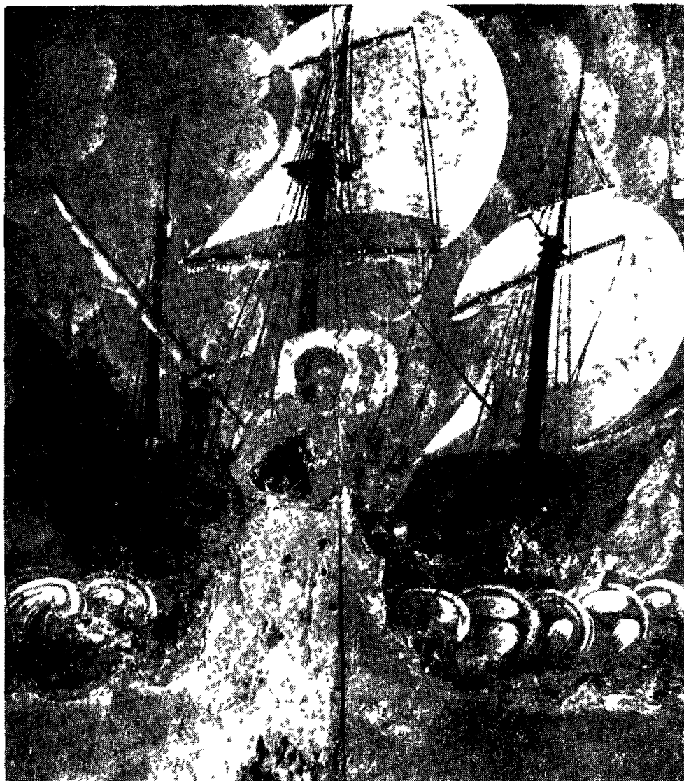
ΣΛΙΚΑ. Φορητή εικόνα του 1620 από την Πάτμο (Ναός Παναγίας Εισημονήτριας)