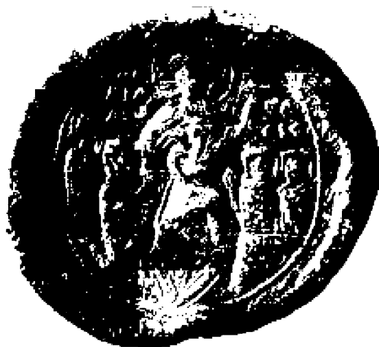
Εικ.1. Το μολυβδόβουλλο του Αλεξίου Κομνηνού. Στον εμπροσθότυπο ο ιδιοκτήτης του μολυβδοβούλλου με στρατιωτική ενδυμασία, πλάι στον στρατιωτικό άγιο Γεώργιο. Στον οπισθότυπο παράσταση της Ανάστασης.