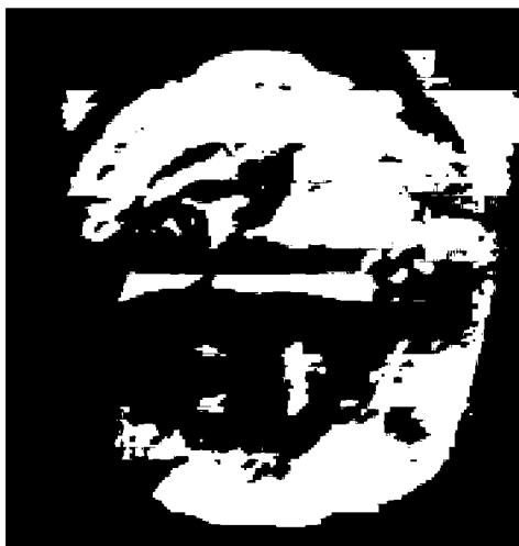
Εικ. 3. Αποτύπωμα σε ζυμάρι της σφραγιστικής επιφάνειας.