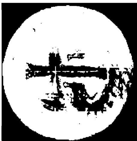
Εικ. 1. Σφραγίδα ευχαριστιακού άρτου από την Πάτρα.